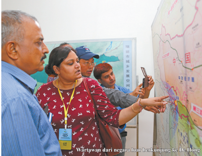
Wartawan dari negara luar berkunjung ke De Hong

KERASAAN saya datang di De hong digunakan dua kata untuk diucapkan, yaitu cantik sampai terkejut. kepala tim kegiatan mengunjunggi Yun nan kaya wawancara media asia selatan dan ASIAN, yang dari <koran nawoda bahas hindia> India Awudes sliwastaya mendapatkan banyak pengalaman kulit dia hitam, senyuman asli, setiap kali tiba di tempat wawancara, dia adalah jalan paling depan.