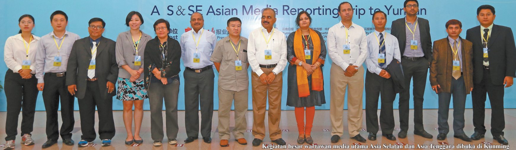
Kegiatan besar wartawan media utama Asia Selatan dan Asia Tenggara dibuka di Kunming

A S & SE Asian Media Reporting Trip to Yunnan