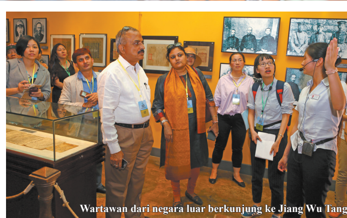
Wartawan dari negara luar berkunjung ke Jiang Wu Tang