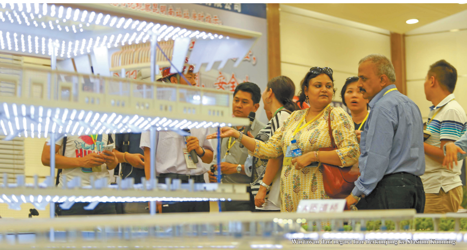
Wartawan dari negara luar berkunjung ke Stasiun Kunming

KOTA Kunming sebagai pusat perkembangan kebijaksanaan politik, ekonomi, sosial dan putaran lalu lintas, adalah posisi terdepan pembangunan satu sabuk satu jalur Yunan dan pusat pengelolaan dalam zone ekonomi kota Dian. Pembangunan dan perkembangan kota Kunming dipuji tim