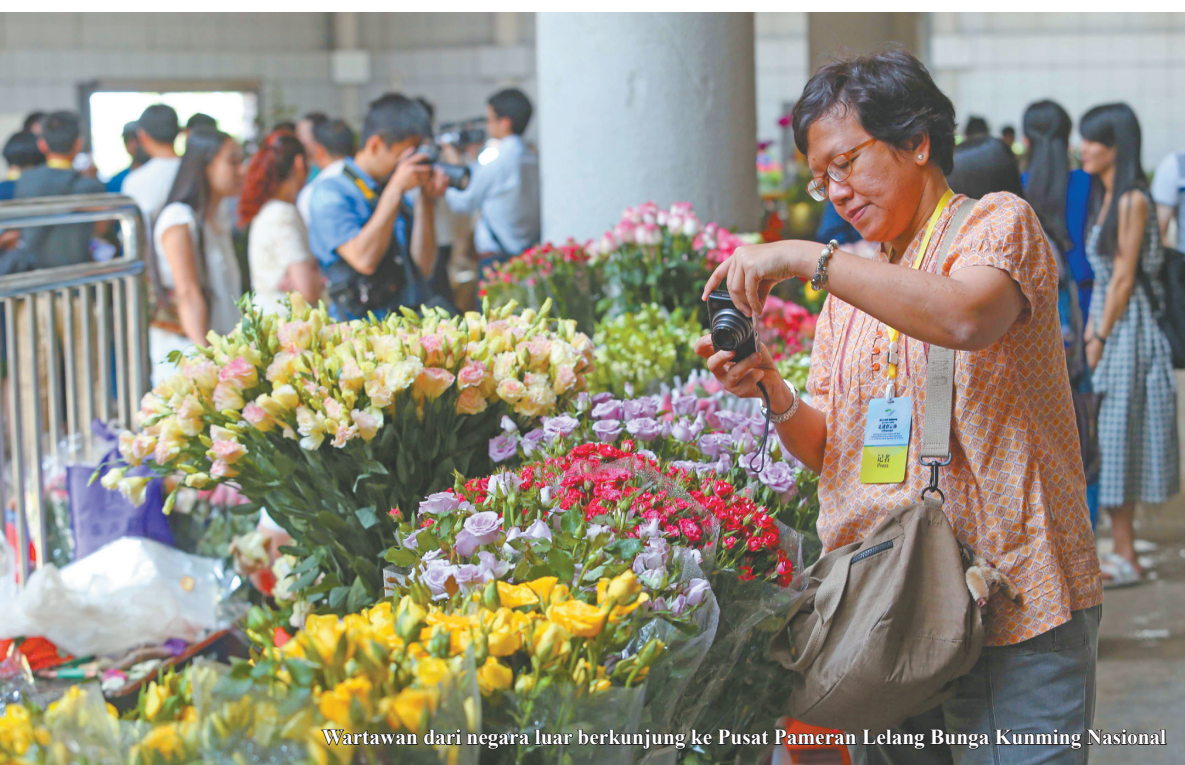
Wartawan dari negara luar berkunjung ke Pusat Pameran Lelang Bunga Kunming Nasional

BUNGA juga boleh dilelang? Sebagai orang Kunming, ini bukan hal baru, tetapi bagi wartawan (media) dari negara asia selatan dan ASIAN, ini mungkin menjadi hal yang menyenangkan. Bagus sekali, itu kesan pertama ketika melihat bunga segar juga bisa dijual dengan lelang. Hal