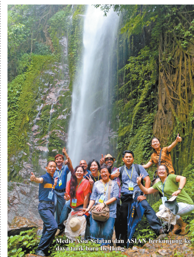
Media Asia Selatan dan ASIAN berkunjung ke daya tarik baru De Hong.

Editor Ingku pun menyampaikan, kota perbatasan di Provinsi pinggir Tiongkok mempunyai kualitas kehidupan seperti ini sangat membuat hati iri.