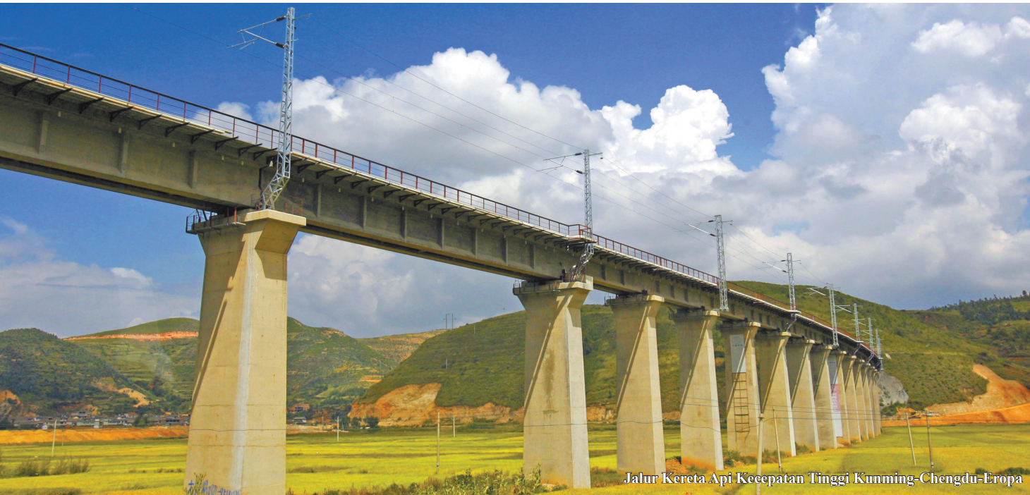
Jalur Kereta Api Kecepatan Tinggi Kunming-Chengdu-Eropa

INFORMASI dari Rapat Tetap Pemerintah Kunming menyebutkan, Kota Kunming akan bekerja sama dengan Kota Chengdu untuk menjalankan angkutan barang Jalan Kereta Api Kecepatan Tinggi Kunming-Chengdu-Eropa.