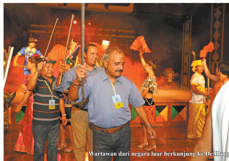
Wartawan dari negara luar berkunjung ke De Hong

PERTAMA kali belajar memakai sumpit, pertama kali menari tarian suku bangsa etnik, pertama kali makan makanan Jing po dengan tangan, pertama kali memakai motor China, pertama kali komunikasi dengan suku bangsa Jing po.