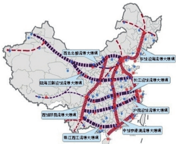
Gambar Kota Pusat Peredaran Tingkat Nasional

PADA 1 Juni, website Kementerian Perdagangan mengeluarkan Rencana Pengaturan Kota Pusat Peredaran Tingkat