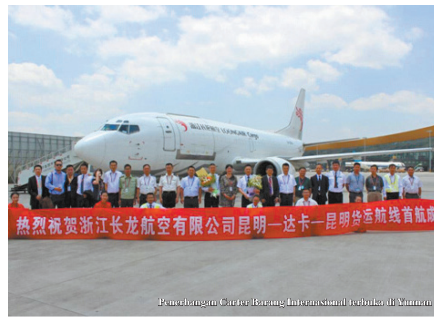
Penerbangan Carter Barang Internasional terbuka di Yunnan

BEBERAPA hari ini, pesawat terbang barang pertama, Boeing 737, tinggal landas dengan sukses dari Kunming ke Dhaka, Bangladesh. Penerbangan ini menunjukkan usaha penerbangan sewaan angkutan barang internasional pertama memulai secara resmi di Bandara Changshui, Kunming.