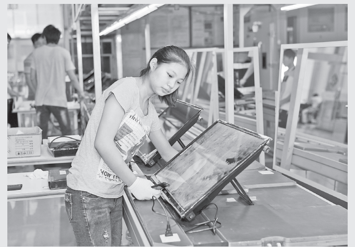
အလုပ်သမားများက တီပီတပ်ဆင်ထုတ်လုပ်လိုင်းတွင် အလုပ်လုပ်နေစဉ်။

နောင်အဆင့်တွင် ကုမ္ပဏီသည် တောင်အာရှ၊ အရှေ့တောင်အာရှ နိုင်ငံများ၏ လုပ်ဆောင်မှုစနစ်ကိုလည်း တီထွင်ထုတ်လုပ်သွားမည်ဖြစ်ပြီး ရွှေလီထုတ်လုပ်ရေးကို ရှေ့သို့ပို့မိရောက်အောင် လျှောက်လှမ်းသွား စေမည်ဖြစ်သည်။ ၂၀၁၅ ခုနှစ် ဖေဖော်ဝါရီလအထိ ချိစိမ်းကုမ္ပဏီသည် အဆိုပါ စီမံကိန်းများအတွက် စုစုပေါင်းယွမ်၃၆သန်း ရင်းနှီးမြှုပ်နှံခဲ့ပြီး တီပီထုတ်လုပ်မှုလိုင်းနှစ်လိုင်း၊ လက်ကိုင်ဖုန်းနှင့် Tablet ထုတ်လုပ်မှု လိုင်းတစ်လိုင်း၊ ဖုန်းမဲ့အလုပ်ရုံတပ်ဆင်မှု လိုင်းတစ်လိုင်းတို့ကို ခေါ်ယူနိုင်ခဲ့သည်။