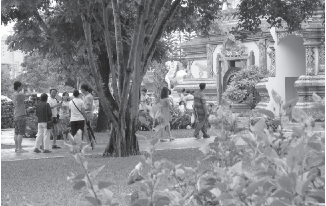
ကုမင်း - ဘန်ကောက်လမ်းမပေါ်ရှိရှုခင်းဓာတ်ပုံ