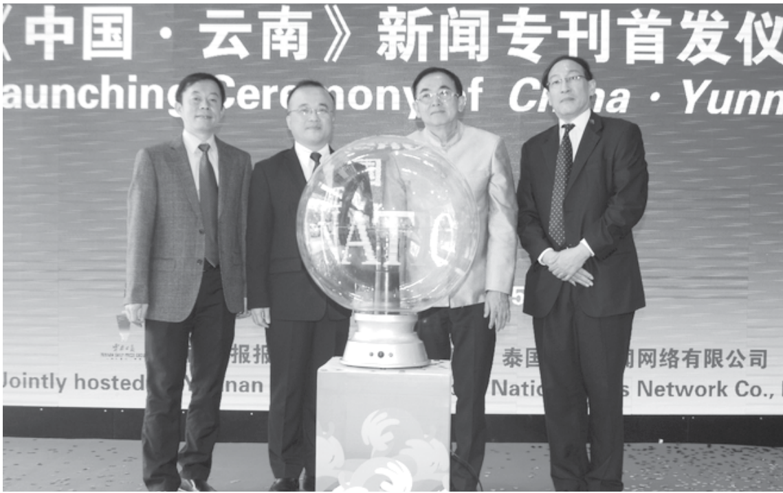
ဖြန့်ဝေပွဲအခမ်းအနား

《တရုတ်•ယူနန်》 အထူးထုတ်သတင်းစာ၏ရည်ရွယ်ချက်မှာ ယူနန်နယ်စပ်ဖြတ်ကျော်ဖွံ့ဖြိုးတိုးတက်ရေး၏ နည်းလမ်းသစ်၊ အခြေအနေသစ်များကို ထည့်သွင်းဖော်ပြရန်၊ ယူနန်မှပြည်သူ့စားဝတ်နေရေးကို ပြုပြင်ပြောင်းလဲပြီး အာမခံပေးသောမူဝါဒဆိုင်ရာနည်းလမ်းများနှင့်ရရှိထားသောအောင်မြင်မှုရလဒ်များကို ထည့်သွင်းဖော်ပြရန်၊ ယူနန်တိုင်းရင်းသားလူမျိုးများစည်းလုံးညီညွတ်ရေးနှင့် နယ်စပ်ဒေသများ၌ သဘာဝတရားသဘာဝသစ်ကိုထည့်သွင်းဖော်ပြရန်၊ ယူနန်သဘာဝပတ်ဝန်းကျင်တည်ဆောက်ရေးစသည့်ဘက်တွင် ရရှိထားသည့် ထူးကဲသောအောင်မြင်မှုများကို ထည့်သွင်းဖော်ပြရန်၊ ယူနန်နှင့်အိမ်နီးချင်းနိုင်ငံများအကြား ခင်မင်ရင်းနှီးသော၊ သင့်မြတ်