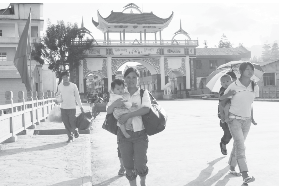
ကူမင်း-ဘန်ကောက်လမ်းမ ကြီးတစ်လျှောက်ရှိ ရွာခင်းဓာတ်ပုံ

ခရီးသွားခြင်းသည် မိမိဘဝ အတွက် အချို့အမှတ်မဲ့အဖြစ်များကို တိုးများပြီး ပြောင်းလဲမှုတစ်ခုမတ်တည်း မရှိခဲ့သော နေထိုင်မှုဘဝ၏ဓမ္မတာကို ချိုးဖောက်စေရန်အတွက်သာဖြစ်သည်။ ခရီးသွားခြင်းသည် နေထိုင်မှုဘဝ ၏ ခဏတစ်ဖြုတ်အချိန်ကို ဖမ်းယူလိုက် ပြီး အလှပဆုံးသော အတိတ်မှတ်တမ်း အဖြစ် ကဲ့လိက်ကာနေဝင်ပြီးသည့်နောက် မှောင်မည်းသွားသော ထောင့်ကြိုထောင့် ကြားများကို ထွန်းတောက်စေရန်အတွက် သာဖြစ်သည်။ သင်သည် မည်သည့်ပွင့် တစ်ခုမဆို သင့်အတိတ်ဘဝနှင့် ဆက် နှယ်မှုလုံးဝမရှိသော အံ့ဖွယ်ပုံပြင်နှင့် ယင်းပုံပြင်ကို ပိုင်ဆိုင်ထားသော မည် သည့် ပုဂ္ဂိုလ်တစ်ဦးမဆို ထိုးစိုက်နိုင် ပြီး ၎င်း၏ယခင်ဘဝနှင့် နောက်ဘဝ အတွက် တာဝန်ယူမှုမဟုတ်ပါ။ ရေစုန် မျောပေဒါပမာ အမှတ်မဲ့တွေ့ဆုံပြီးသည့် နောက် ထွက်ခွာသွားခြင်းဖြစ်သည်။