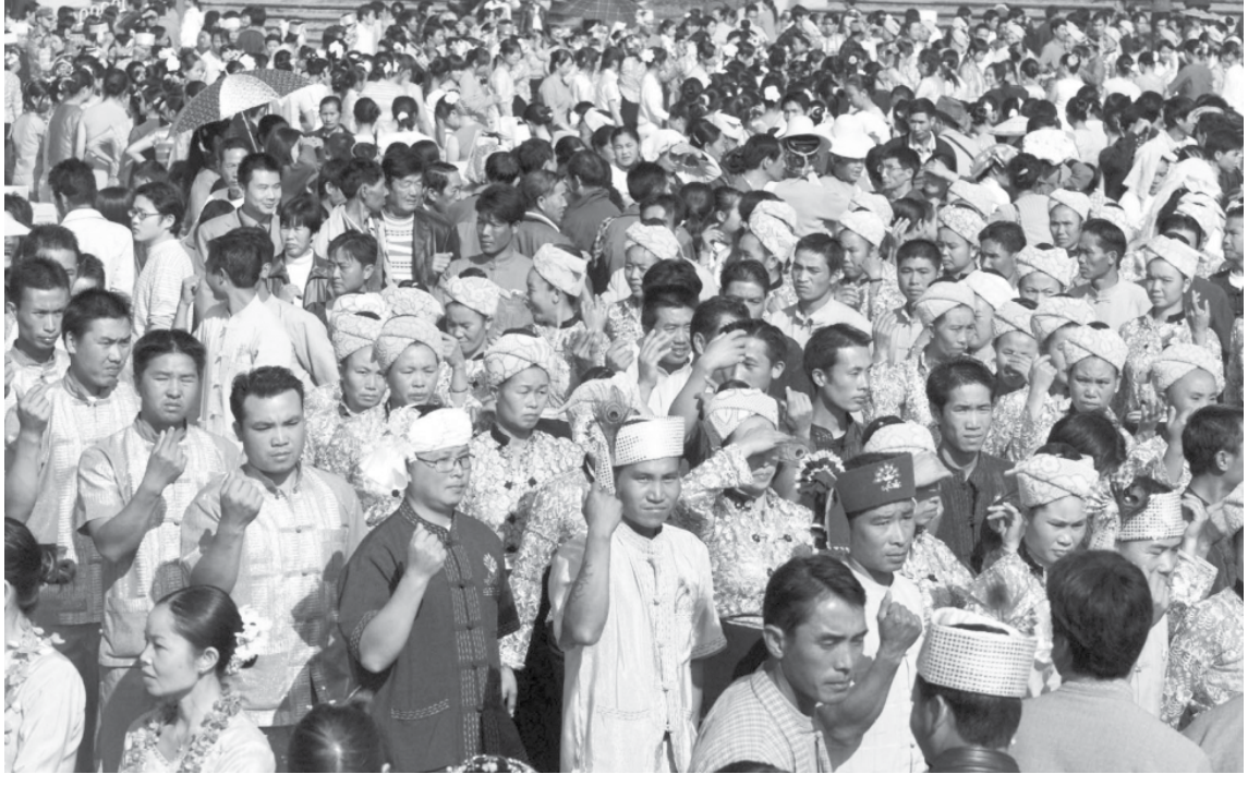
ကူမင်း-ဘန်ကောက်လမ်းမ ကြီးတစ်လျှောက်ရှိ ရွာခင်းဓာတ်ပုံ

ထွန်းလင်းတောက်ပသော အရာ ဝတ္တရီရစမြဲပါ။ အနာဂတ်တွင် ကျွန်တော် တို့သည် နေရာတစ်နေရာတည်းတွင် နေထိုင်ကြသောကြောင့် ပခုံးချင်းယှဉ် လျှောက်သွားသင့်မှာ မဟုတ်ပါ။ သတင်းဆောင်းပါး - ရန်ရှိုးကျို