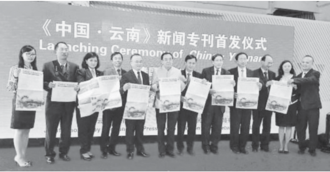
ဖြန့်ဝေပွဲအခမ်းအနား

သတင်းထောက်-လီဟုန်ဖုန်း၊ ဝမ်ကျန်း၊ လျူရန်ချင်