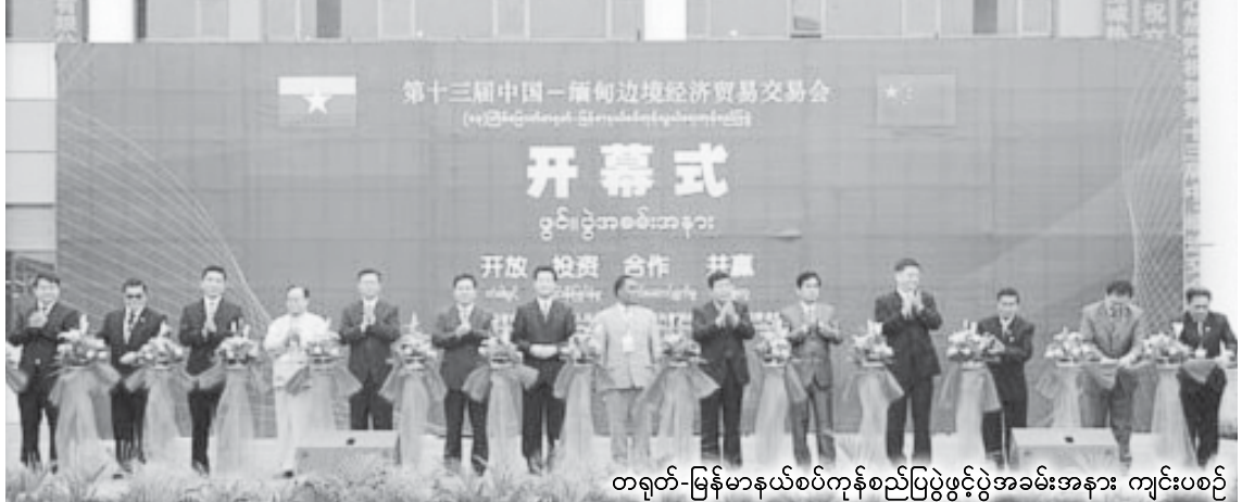
တရုတ်-မြန်မာနယ်စပ်ကုန်စည်ပြပွဲဖွင့်ပွဲအခမ်းအနား ကျင်းပစဉ်

လေ့လာရေးအဖွဲ့က စုပေါင်းဓာတ်ပုံရိုက်ကြစဉ်။ မကြာသေးမီ တရုတ်ပြည်လုံးဆိုင် ရာ သတင်းသမားများအသင်း (တရုတ် သတင်းထောက်များအသင်း)က ကြီးမျိုး ကျင်းပခဲ့သော မြောက်အမေရိကတိုက်မှ တရုတ်ဘာသာမီဒီယာများ “တစ်ဇန် တစ်လမ်း” မဟာဗျူဟာဆိုင်ရာ သုတေ သနလေ့လာရေးအစီအစဉ်ကို ယူနန် တွင် ကျင်းပခဲ့သည်။ အမေရိကန်နိုင်ငံမှ ရောက်ရှိလာသော တရုတ်ဘာသာ မီဒီယာ(၈)ခု၊ ကနေဒါနိုင်ငံမှ ရောက်ရှိ လာသော တရုတ်ဘာသာမီဒီယာ(၆)ခု တို့မှ ကိုယ်စားလှယ်များသည် ကူမင်းမြို့ နှင့်ထိမ်းချမ်းခရိုင်တို့တွင် နက်ရှိုင်းစွာ သုတေသနပြုလေ့လာခဲ့ပြီး အောင်မြင်မှု ရလဒ်များစွာရရှိခဲ့သည်။ ရှေးခေတ်တောင်ပိုင်းပိုးလမ်းမ ကြီး၏အစပြုရာနေရာနှင့် “ပိုးလမ်းမကြီး စီးပွားရေးရပ်ဝန်း”၏ အချက်အချာမြို့ အဖြစ် ယူနန်ပြည်နယ်သည် “တစ်ဇန် တစ်လမ်း” မဟာဗျူဟာစနစ်တွင် အရေးပါသည့်အခန်းထဲ ပါဝင်နေဆဲဖြစ် သည်။ လေ့လာရေးအဖွဲ့သည် ကူမင်း မြို့တွင် ယူနန်စီမံ အုပ်ချုပ်ရေးကော်လိပ် ပြည်နယ်အခြေအနေနှင့် ပေါ်လစီရေး ရာသုတေသနဌာနမှ တာဝန်ရှိသူကို အထူးဖိတ်ခေါ်ပြီး ယူနန်ပြည်နယ်၏ လက်ရှိအခြေအနေကို မိတ်ဆက်ပေးခဲ့ သည်။ တစ်ချိန်တည်းတွင် “တစ်ဇန် တစ်လမ်း” တိုက်တွန်းချက်အောက်တွင် ယူနန်၏ ဖွံ့ဖြိုးတိုးတက်ရေးအခွင့်အရေး နှင့် ရှေ့အလားအလာနှင့် စပ်လျဉ်း၍ နက်ရှိုင်းစွာ ဆွေးနွေးဖလှယ်ခဲ့သည်။ သတင်းထောက် - ရက်ရို