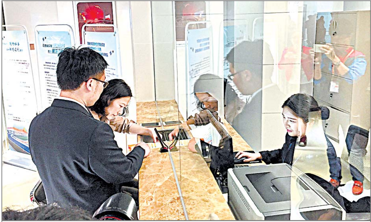
លោកស្រីលីជិនជាតិអាមេរិកដើរកំណើតចំនួនកំពុងតែប្រើប្រាស់សេវាប្រាក់ពន្ធចាកចេញ នៅអាកាសយានដ្ឋានអន្តរជាតិកុងមីញូ