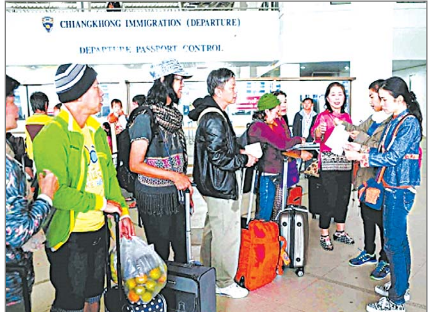
ភ្ញៀវទេសចរណ៍កំពុងតែចាកចេញ ពីតំបន់លេងបៀងប្រទេសថៃក្នុងមកកាន់រដ្ឋស៊ីស្ទាង ប៉ាន់ណានៅខេត្តយួនណានប្រទេសចិន

ទស្សនកិច្ចលើកនេះ គឺផ្អែកដោយសហគ្រាសទេសចរណ៍មកពីទីក្រុងលេងបៀងប្រទេសថៃ និងរដ្ឋស៊ីស្ទាង ប៉ាន់ណា ខេត្តយួនណាន ។ អ្នកតំណាងវិស័យទេសចរណ៍នៃប្រទេសចិននិងថៃ និងម៉ាឡេស៊ី ដែលបានចូលរួមទស្សនកិច្ចលើកនេះទាំងនោះបានថ្លែងថា ប្រទេសចិននិងម៉ាឡេស៊ី ប្រតិបត្តិការលើវិស័យទេសចរណ៍ថៃមុនគេដែរ ។