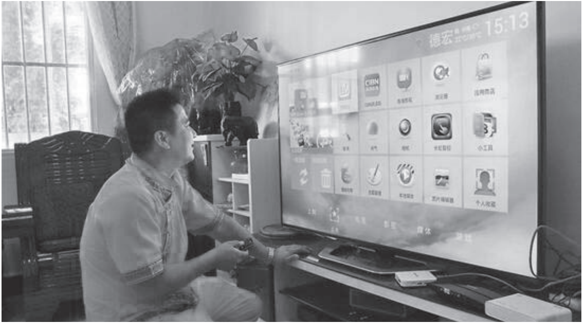
မော့အိုက်ရှန်းကျောင်းက အိမ်ကအင်တာနက်အပေါ်မှာ သတင်းအချက်အလက်များကို ရှာဖွေကြည့်ရှုနေပုံ။

အဆက်မပြတ်ရှည်လျားနေသော “အိုင်တီ အချက်အလက် အမြန်လမ်း” တလျှောက်လျှောက်လှမ်းရင်း သတင်းထောက်တို့သည် ကျေးရွာထဲသို့ဝင်ရောက်ကာရွာသူရွာသားများနှင့် အတူ “Broadband ကျေးရွာ” က ရွာသားများအပေါ်ပေးအပ်လာသော ပျော်ရွှင်မှုများကို မျှဝေခံစားနေပါတော့သည်။ ဝမ်း၊ ဝမ်း၊ ဝမ်း၊ ကျယ်လောင်သော ရှမ်းအိုးစည်အသံအကြားမှာ မန်ဟွမ်ရွာမှ ကျေးရွာခေါင်းဆောင်မော့