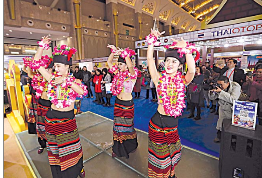
កម្មវិធីសម្តែងសិល្បៈនៅ ពិព័រណ៍ផលិតផលប្រទេសទន្លេមេគង្គ និងវេទិកាបឹងទន្លេយើងនៃកិច្ចសហប្រតិបត្តិការទន្លេមេគង្គ-មេគង្គ រៀបចំនៅក្រុងគុនមីង