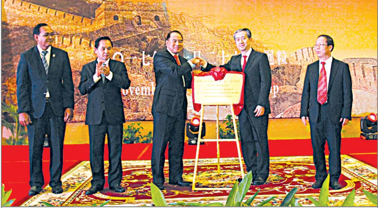
ពិធីបើកសម្ពោធនាគារវិស័យការិយាល័យកុងស៊ុលចិន នៅខេត្តស្ប៉េមរាប

នៅថ្ងៃទី ២៦ ខែវិច្ឆិកា ស្ថានទូតប្រទេសចិនប្រចាំនៅប្រទេសកម្ពុជា រៀបចំពិធីបើកសម្ពោធនាគារវិស័យការិយាល័យកុងស៊ុលនៅខេត្តស្ប៉េមរាប ។