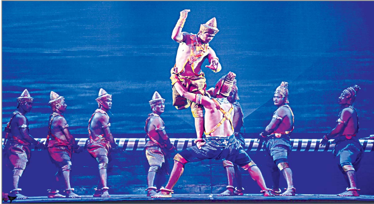
រូបថតនាវាមួយនៃកម្មវិធី 'ស្នាមញញឹមអង្ករ' ដែលជាកម្មវិធីវប្បធម៌មួយដែលចូលរួមដំណើរការដោយកម្ពុជា និង ខេត្តយួនណានរបស់ចិន (រូបថតដោយ Wang Bangxu)

នៅឆ្នាំ២០១១ កម្មវិធីសម្តែងសិល្បៈស្នាមញញឹមអង្ករដែលរៀបចំដោយក្រុមហ៊ុនវិនិយោគវប្បធម៌ខេត្តយួនណាន និងស្ថាប័នវប្បធម៌នៃប្រទេសកម្ពុជា បានត្រូវសម្តែងជាលើកដំបូងនៅតំបន់អង្ករនៃប្រទេសកម្ពុជា ។ គិតតមកដល់ពេលនេះ កម្មវិធីស្នាមញញឹមអង្ករ នេះ បានសម្តែងជាង ២.០០០លើកនៅប្រទេសកម្ពុជាដែលបានទទួលនូវចំណូលជាង២០០ លានដុល្លារក្នុងមួយឆ្នាំ ហើយបានទទួលរង្វាន់រួមវិភាគទានសេវាកម្មទេសចរណ៍ពីសេសដែលផ្តល់ដោយរាជរដ្ឋាភិបាលកម្ពុជា។ ភាគីទាំងពីរចិន និងកម្ពុជាជួរមុខសហការគ្នាយ៉ាងស្និតស្នាលក្នុងការបណ្តុះបណ្តាលនូវវិស្វកម្មវិធីសម្តែងដែលបានធ្វើឱ្យទស្សនិកជនទូទាំងពិភពលោកស្គាល់កាន់តែច្បាស់នូវសម្រស់ស្នាមញញឹមនៃវប្បធម៌ខ្មែរ។ នេះបានបង្ហាញពីខ្លឹមសារសំខាន់នៃវប្បធម៌ខ្មែរ រួមគ្នាពិគ្រោះពិភាក្សាស្ថាបនា និង