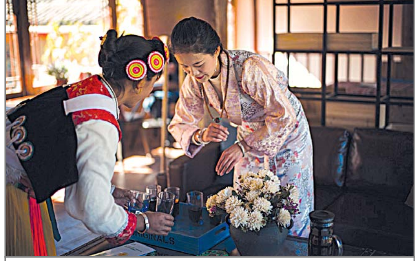
មណ្ឌលស្វយ័តជំនាញបេតិកភ័យ រីយ៉ាង ដែលស្ថិតនៅភាគពាយ័ព្យនៃខេត្តយួនណាន គឺជាមរណីដ្ឋាន អភិវឌ្ឍន៍ទេសចរណ៍ដ៏ចម្បងនៅក្នុងខេត្តយួនណានកំពុងតែបង្កើនប្រាក់ចំណូលដល់ប្រជាពលរដ្ឋមូលដ្ឋាន និងជួយកាត់បន្ថយភាពក្រីក្ររបស់ប្រជាជន

ក្នុងកិច្ចប្រជុំសភាតំណាងប្រជាជន និងសភាប្រឹក្សានយោបាយប្រជាជនទូទាំងប្រទេសចិនដែលរៀបចំនៅឆ្នាំ២០១៨ នេះ ការកាត់បន្ថយភាពក្រីក្រគឺជាបញ្ហាគុកុកុដ៏សំខាន់ដែលបានទទួលនូវការចាប់អារម្មណ៍ពីអង្គប្រជុំប្រទេសចិនបានលើកឡើងនូវគោលដៅប្រចាំឆ្នាំ២០២០ ថា ប្រទេសចិននឹងកាត់បន្ថយភាពក្រីក្រទាំងស្រុងនៅតាមតំបន់ជនបទ។ ទោះបីជាប្រទេសចិនកំពុងប្រឈមនឹងក្តីលំបាកដ៏ច្រើនក្នុងការកាត់បន្ថយភាពក្រីក្រក៏ដោយ ក៏ប៉ុន្តែសហគមន៍អន្តរជាតិនៅតែមានជំនឿយ៉ាងមុតមាំថាគោលដៅដែលកំណត់ដោយរដ្ឋាភិបាលចិន គឺជាគោលដៅដែលអាចសម្រេចបាន។ ប្រទេសចិនកំពុងធ្វើដំណើរតាមផ្លូវត្រីមត្រូវសម្រាប់ជំរុញការអភិវឌ្ឍបុព្វហេតុកាត់បន្ថយភាពក្រីក្រត្រឹមត្រូវនៃសមិទ្ធផលរបស់ប្រទេសចិននឹងអាចលើកទឹកចិត្តឱ្យប្រទេសផ្សេងៗទៀតខិតខំជំរុញការអភិវឌ្ឍន៍នៃបុព្វហេតុកាត់បន្ថយភាពក្រីក្រឱ្យទទួលបាននូវសមិទ្ធផលកាន់តែច្រើនថែមទៀត។