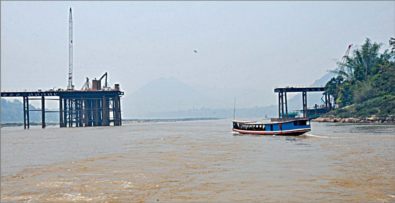
ស្ថានីយ៍ប្រចាំកម្រិតខ្ពស់នៅទីក្រុងឡាវ គឺជាផ្នែកមួយនៃខ្សែរថភ្លើងចិន-ឡាវ កំពុងតែស្ថិតនៅក្នុងដំណាក់កាលស្ថាបនា (រូបថត ស៊ីនហ្វា)

នៅខែមេសា អាស៊ានអាណត្តិក្នុងប្រទេសឡាវ ពិតជាជោគជ័យខ្លាំង ។ ក្នុងឱកាសបុណ្យចូលឆ្នាំប្រពៃណីប្រជាជនដែលរស់នៅក្នុងតំបន់ខាងជើងនៃប្រទេសឡាវ រួមគ្នាប្រារព្ធនូវបុណ្យប្រពៃណីដ៏សំខាន់នេះ ចំណែកកម្មករដែលធ្វើការនៅការដ្ឋានសាងសង់ខ្សែរថភ្លើងចិន-ឡាវកំពុងតែខិតខំឧស្សាហកម្មយ៉ាងម៉ឺងម៉ាត់សាងសង់ខ្សែរថភ្លើងសំខាន់នេះឱ្យបានល្អប្រសើរ ។