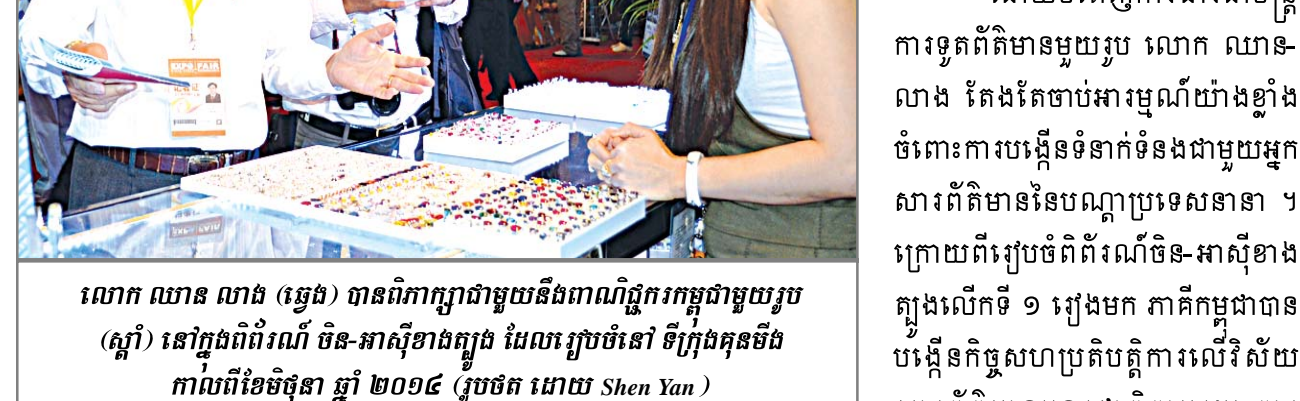
លោក ឈាន លាង (ឆ្វេង) បានពិភាក្សាជាមួយនិងពាណិជ្ជករកម្ពុជាមួយរូប (ស្ត្រី) នៅក្នុងពិព័រណ៍ ចិន-អាស៊ីខាងត្បូង ដែល រៀបចំនៅ ទីក្រុងកូឡូម៉ូ កាលពីខែមិថុនា ឆ្នាំ ២០១៨ (រូបថត ដោយ Shen Yan)

នៅថ្ងៃទី ១៤ ខែមិថុនា ឆ្នាំ ២០១៨ ពិព័រណ៍ចិន-អាស៊ីខាងត្បូង លើកទី៥ និងផលិតផលនាំចេញនាំចូលក្រុងកូឡូម៉ូលើកទី២៥ និងបើកពិព័រណ៍ ក្នុងក្រុងកូឡូម៉ូនៃខេត្តយួនណាន ។ ពេលថ្មីៗនេះ លោក ឈាន លាង ទីប្រឹក្សារដ្ឋមន្ត្រីក្រសួងព័ត៌មាន និង ជាអគ្គនាយករងនៃទស្សនវិទ្យាស្ថានព័ត៌មានកម្ពុជា បានផ្តល់បទសម្ភាសន៍ជាមួយអ្នកសារព័ត៌មាននៃទស្សនាវដ្តី "ខ្មែរ" ។