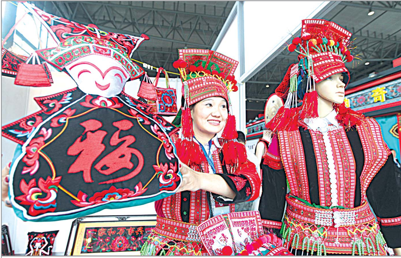
សម្លៀកបំពាក់ប្រពៃណីជនជាតិហ្វូយ៉ាវ យី នៅពិព័រណ៍វប្បធម៌ ច្នៃប្រឌិតខេត្តយួនណាន កាលពីឆ្នាំទៅ

នៅថ្ងៃទី៥ ខែកក្កដា ឆ្នាំ ២០១៨ តាមប្រភពព័ត៌មានគណៈកម្មាធិការ រៀបចំពិព័រណ៍បានឱ្យដឹងថា ពិព័រណ៍ វប្បធម៌ច្នៃប្រឌិតខេត្តយួនណានឆ្នាំ ១៣ ខែសីហា ឆ្នាំ ២០១៨ ។