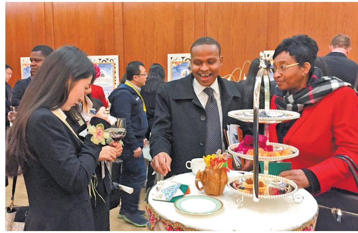
Kegiatan merekomendasikan diadakan di Beijing

Di Yunnan ada udara segar, pemandangan indah, kebudayaan yang bermacam-macam dan sumber daya binatang dan tumbuhan yang kaya.