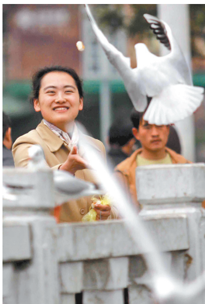
Camar dan penduduk kota