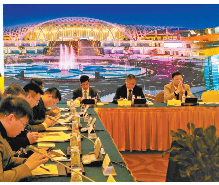
Acara promosi Pameran Negara Asia Selatan dan Asia Tenggara 2017

Wawancara Wawancara dengan Konsul Jendral Jerman di Chengdu, Schmidt → P4