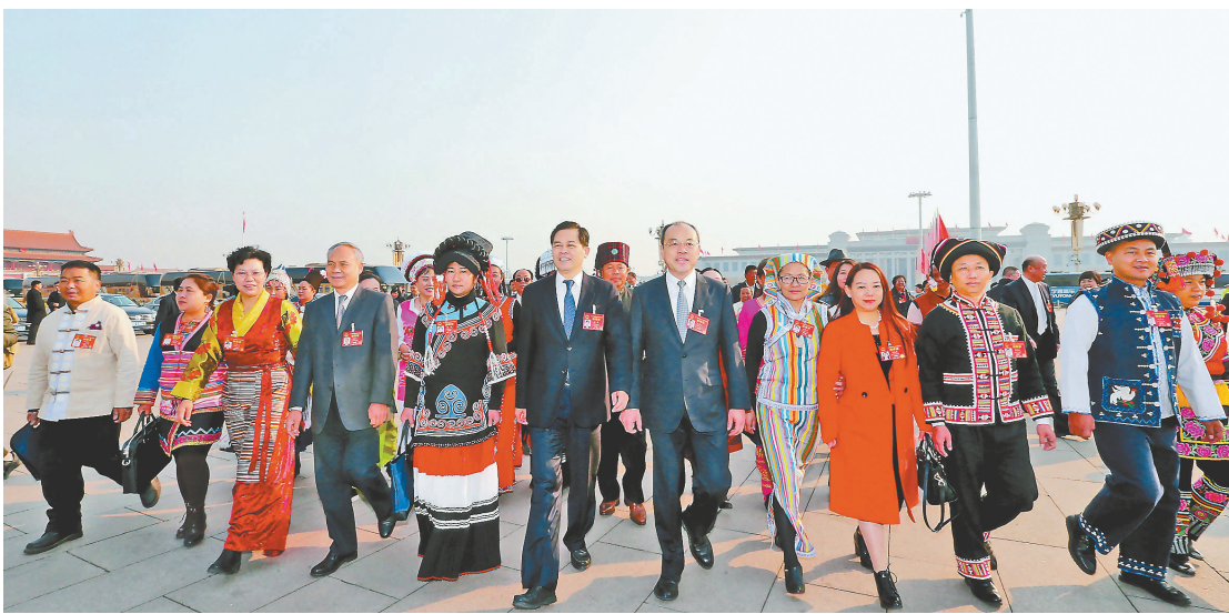
Delegasi Yunnan yang mengikuti Sidang Ke-5 KRN Ke-12 mengadakan rapat