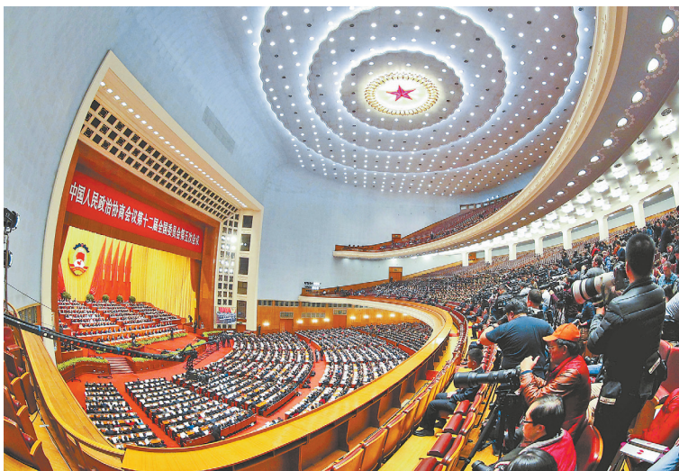
KRN dan MPPR Tiongkok 2017 Diselenggarakan di Beijing

Dana khusus kebebasan dari kemiskinan finansial sentral meningkat 30% lebih. Mendorong integrasi dana pertanian kabupaten miskin, memperkuat pengawasan dana dan proyek.