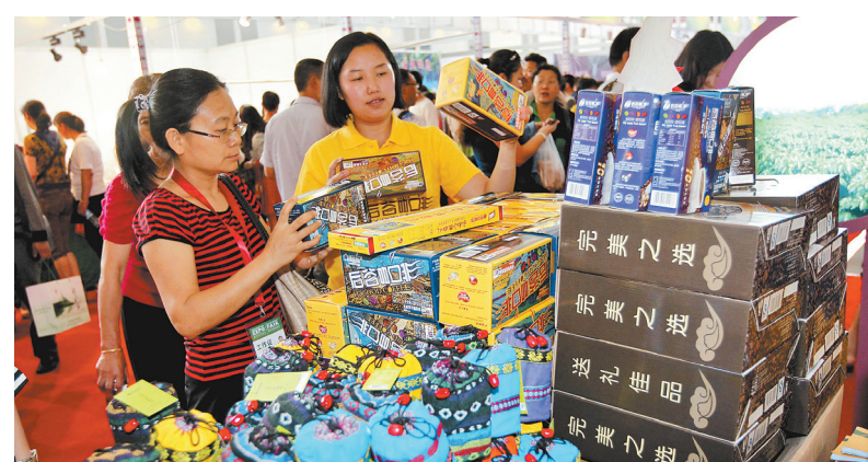
Kopi Hougu Masuki Pasar

Di masa depan, kopi Hougu juga akan dimasuki ke dalam internet data perkembangan kopi. Menurut internet, pembeli bisa minum kopi yang cocok dengan selera sendiri, dan juga bisa melihat gambaran basis penanaman kopi. Wu Ping