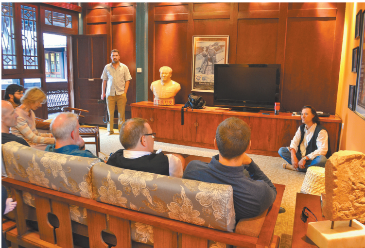
“Kepala Desa” Lin (kana) dari Amerika