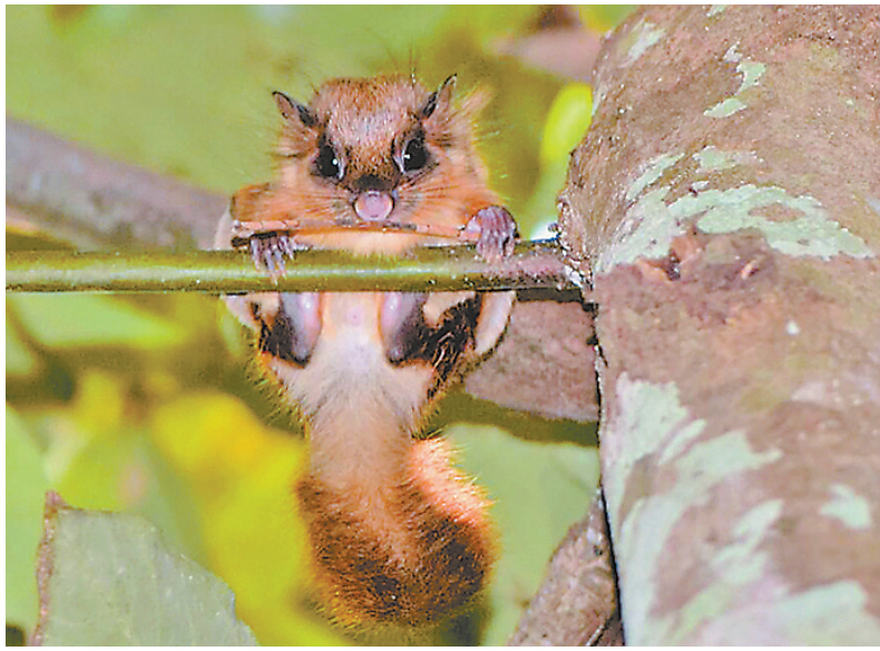
Bajing Bertelinga Bulu