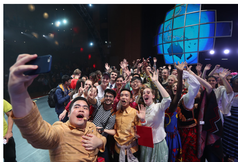
Pertandingan Mandarin Pelajar SMA Dunia Chinese Bridge Ke-10 ditutup

Pertandingan Mandarin Pelajar SMA Dunia Chinese Bridge Ke-10 ditutup di Yunnan Theater.