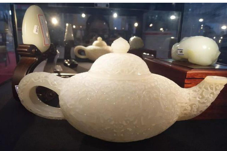
Pameran Permata Internasional Kunming Yunnan Tiongkok ke-7