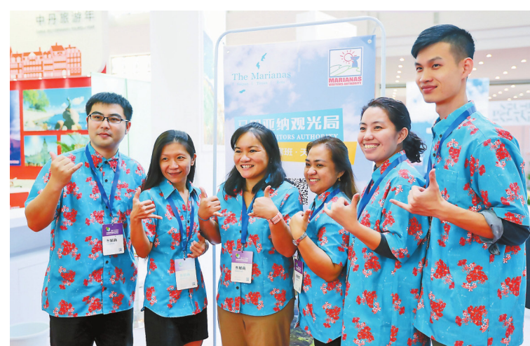
Pameran Wisata Internasional Tiongkok yang diadakan di Kunming