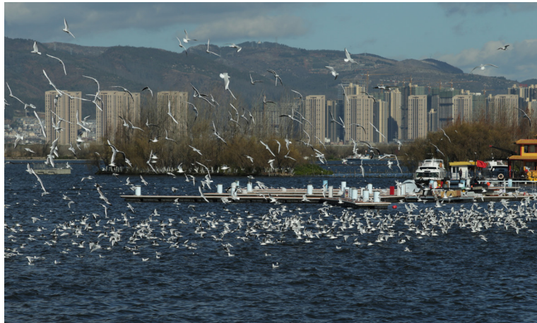
Tata kelola dan perencanaan bersama. Danau Dianchi telah menjadi rumah burung camar, menarik puluhan ribu burung camar datang melewati musim dingin setiap tahun.