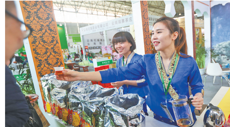
Di Pameran Internasional Expo Industri Teh Tiongkok (Kunming) 2018, teh hitam ekologi merek asli Laos “Jin Zhanba” dan teh pohon kuno Luang Prabang menarik banyak penduduk kota dan teman teh datang dan membelinya.