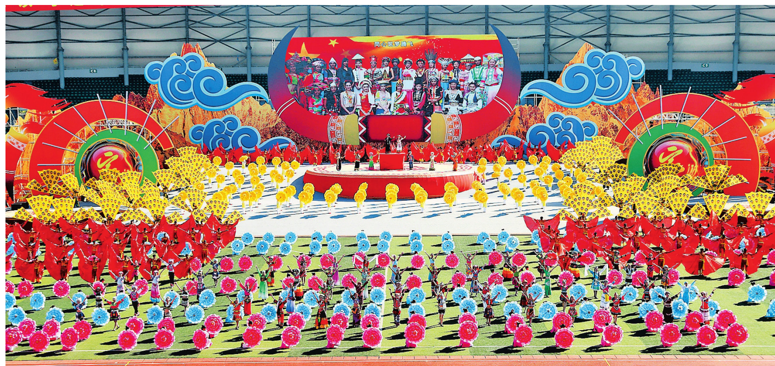
Pertandingan Olahraga Tradisional Suku Minoritas Yunnan ke-11 dibuka di Pusat Olahraga Lincang pada 4 Desember. Ada 14 item utama dan 131 item kecil dalam acara olahraga ini, dan ada 57 pertunjukan dalam 4 kategori. Sebanyak 1899 atlet dari 18 delegasi berpartisipasi, mereka dari 16 keresidenan dan kota di Provinsi Yunnan, serta Universitas Normal Yunnan dan Universitas Nasionalitas Yunnan.