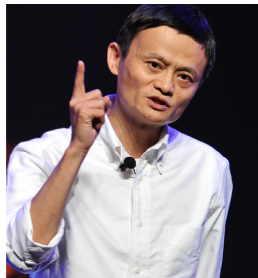
Pengantar: Ma Yun, Lahir di Hangzhou, Provinsi Zhejiang pada 10 September 1964, pendiri Grup Alibaba.

Catatan Redaksi: 40 tahun reformasi dan keterbukaan Tiongkok adalah zaman yang membutuhkan pejuang dan juga zaman yang menunaikan pejuang. Sejak kali ini, edisi ini akan menceritakan beberapa kisah pejuang. Mereka adalah "wirausaha" paling awal dalam reformasi dan keterbukaan Tiongkok, dan mereka adalah "perintis" di jalan reformasi. Di zaman reformasi dan keterbukaan, mereka berusaha dan berjuang dengan tanggung jawab dan impian.