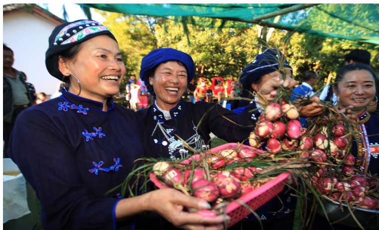
Kegembiraan orang Suku Hani untuk panen.

Saat ini, Yunnan menggunakan posisi perbatasan, mengambil “kelancaran” sebagai prioritas dan “harmoni” sebagai dasar, serta mementingkan “kerja sama” sebagai kunci, membentuk mekanisme baru untuk pertukaran yang luas, bertingkat dan menyeluruh, menjadi jembatan yang baik untuk Tiongkok dan negara-negara tetangga mengembangkan kerja sama strategis.