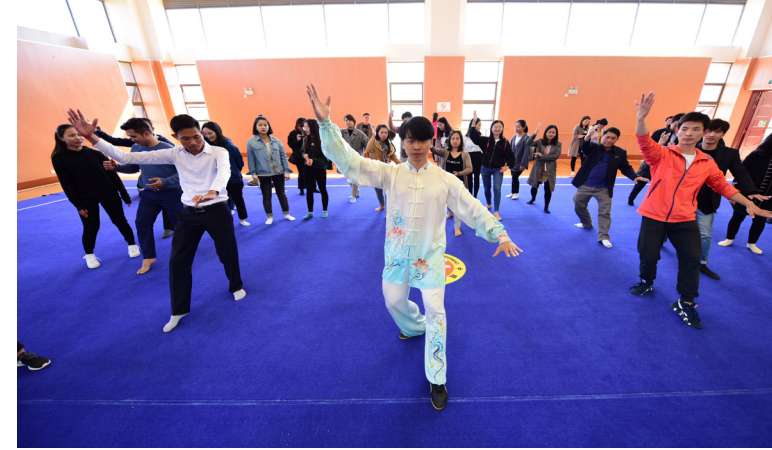
Mahasiswa asing sedang belajar Taiji.