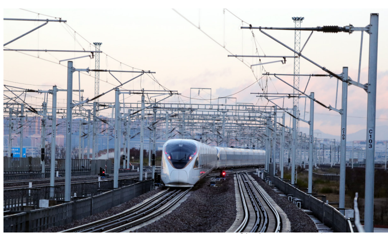
Pertemuan grafik data Kereta Cepat Yunnan

Tersambungnya kereta cepat memberi kekuatan pendorong baru untuk Pasar Bunga Dounan. Semakin banyak wisatawan datang ke Pasar Bunga Dounan sebagai perhentian terakhir di Yunnan, “membawa beberapa bunga Kunming ke rumah.”