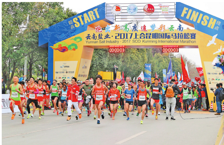
Maraton SCO Kunming 2017 dimulai di pinggir Danau Dianchi

Pada 31 Desember 2017, pertandingan PT. Garam Yunnan, Maraton SCO Kunming 2017 dimulai di pinggir Danau Dianchi, Kunming. Sekitar 16 ribu orang pemain dalam dan luar negeri ikut pertandingan ini, camar dan orang berolahraga bersama.