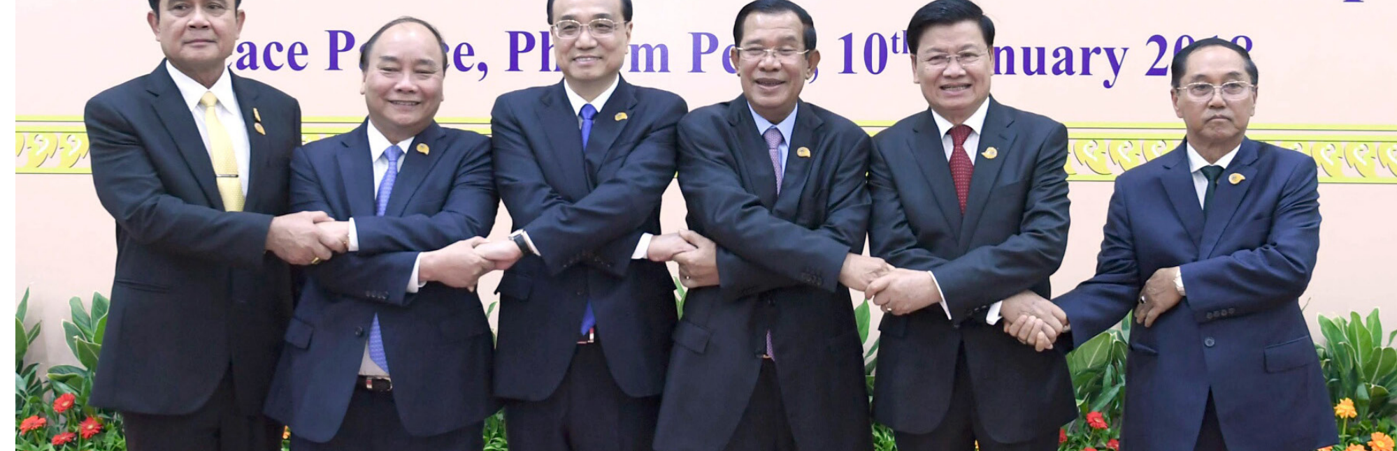
Sidang Pemimpin Ke-2 Kerja Sama Lancang-Mekong dibuka di Phnom Penh

Peace Pledge, Phnom Penh, 10 th January 2018