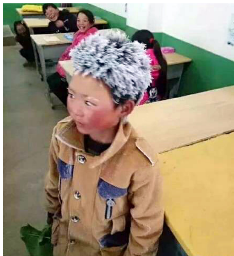
Anak Laki-laki Es di Zhao Tong Yunnan

Saat ini, organisasi yang berkaitan di provinsi Yunnan membuat prakarsa “gerakan menghangatkan