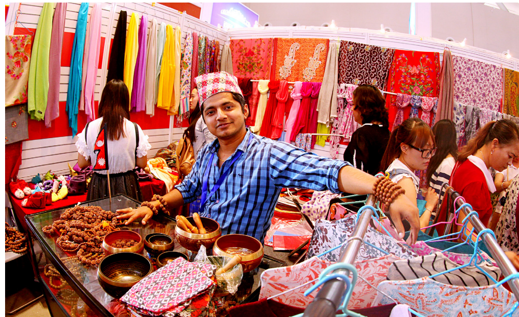
Pertemuan grafik data CSA-EXPO

China-South Asian Expo Ke-5, Pameran Perdagangan Impor dan Ekspor Kunming Tiongkok Ke-25, dan Forum Pengajakan Investasi dari Perusahaan Nasional di Yunnan diadakan di Kunming. Diperkirakan lebih dari 80 negara dan daerah akan mengikuti CSA-Expo ini.