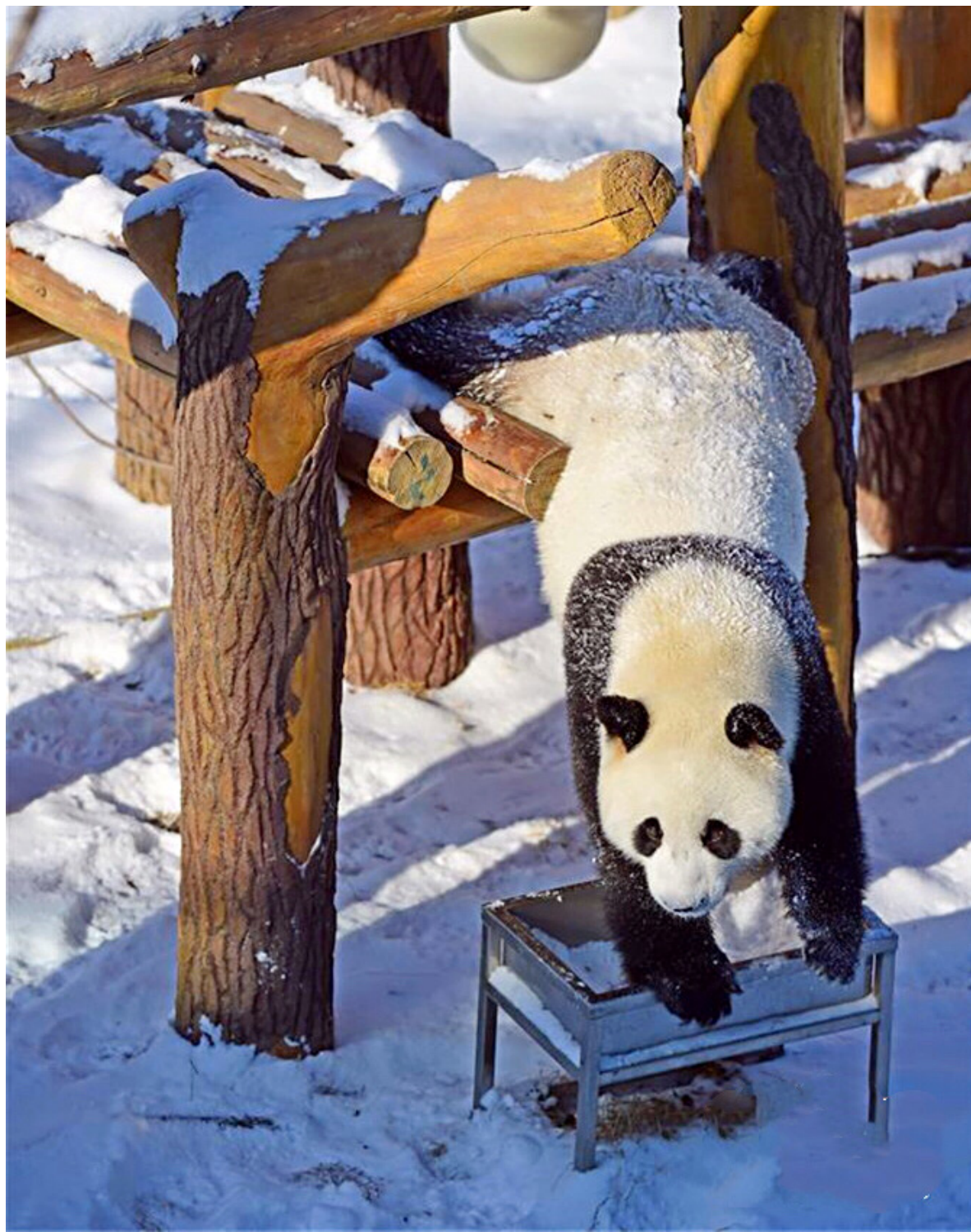
Setelah memasuki musim dingin, sebagian besar daerah utara Tiongkok turun salju. Salju seperti memberi baju putih untuk tanah Tiongkok. Ikon Tiongkok yaitu Panda, sangat senang main dengan salju. Foto ini diambil di Taman Binatang Hutan Shenyang, dimana Panda bermain dan menikmati salju.