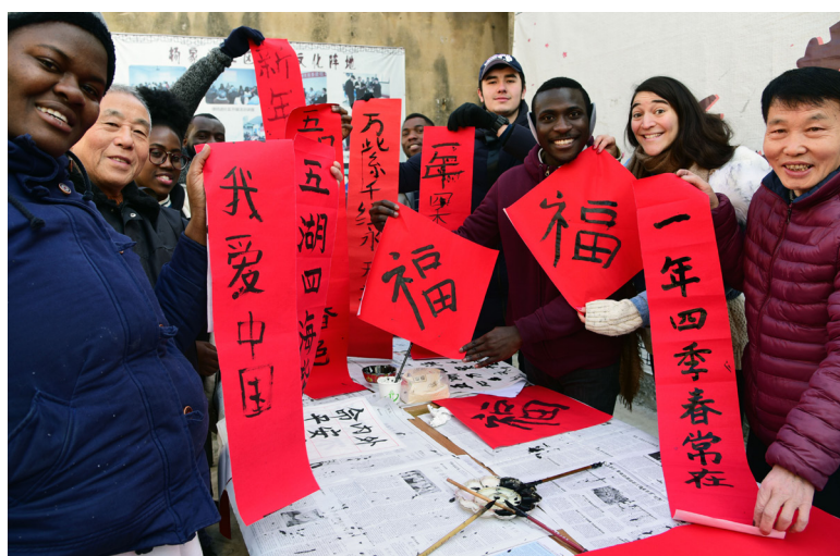
Mahasiswa asing belajar kebudayaan Tionghoa "Tiongkok", dari beberapa tahun lalu sudah menjadi semacam kepopuleran, dan sekarang ada banyak mahasiswa India mulai belajar istilah "dokter India dibuat di