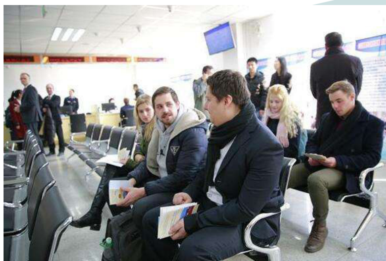
Ahli asing di Yunnan.

Untuk mempercepat pekerjaan penarikan tenaga ahli