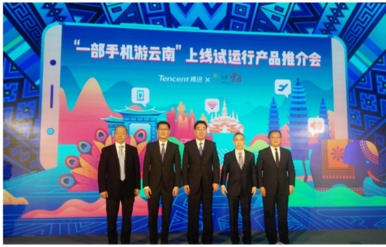
“Berjalan di Yunnan dengan HP” pelaksanaan percobaan.

“Berjalan di Yunnan dengan HP” sejak pelaksanaan percobaan pada 1 Maret, 10 kawasan wisata percobaan seperti World Horti-Expo Garden Kunming, Desa Etnik Yunnan, Kota Kuno Dali, Gunung Jizu Binchuan, Kawasan Wisata Kebudayaan Santa Kuil Chong-