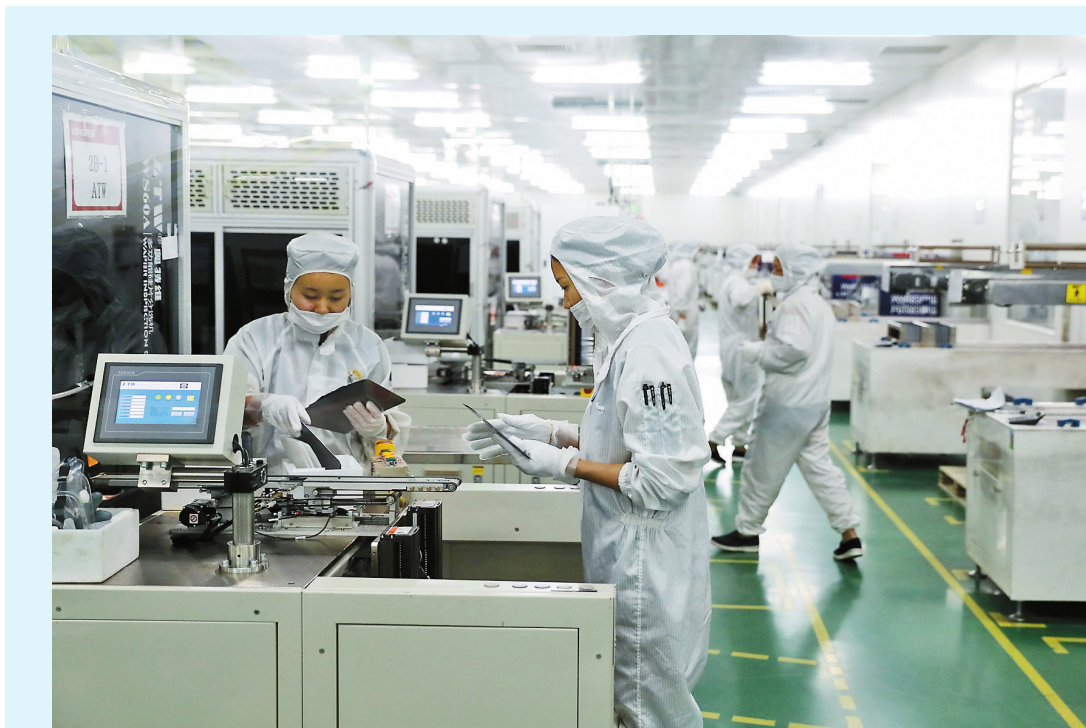
PT. Bahan Silisium Longji Chuxiong adalah cabang PT. Teknologi Lvneng Longji yang didirikan di Kabupaten Lufeng, Keresidenan Chuxiong.

Pekerjaan utamanya adalah mengolah silikon monokristalin yang digunakan untuk pembangkit listrik tenaga matahari. Proyek silikon monokristalin yang diproduksi 10GW setiap tahun oleh Longji Chuxiong diperkirakan memerlukan investasi sebanyak 2,5 miliar Yuan. Proyek ini mulai dibangun pada 7 April 2017, dan mulai diproduksi pada 13 Januari 2018, setelah investasinya diselesaikan, kapasitas produksi terbesar akan melebihi 12GW, volume penjualan tahunan bisa melebihi 12 miliar Yuan, akan menjadi pabrik silikon monokristalin pertama di dunia. Chen Fei