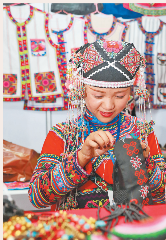
Pada 9 Agustus, Kreasi Yunnan•Pameran Industri Budaya 2018 dibuka di Kunming International Convention Center.