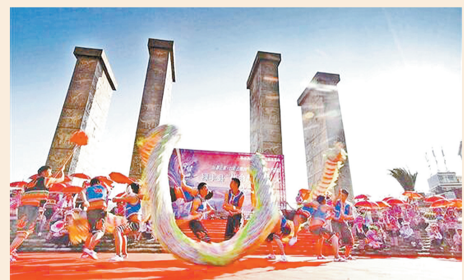
2月18日，“生命起源”之火在祿豐世界恐龍谷正式點燃，象徵着希望與祝福的火炬傳遞，開啓絲綢雲裳·七彩雲南2019民族賽裝文化節大幕。