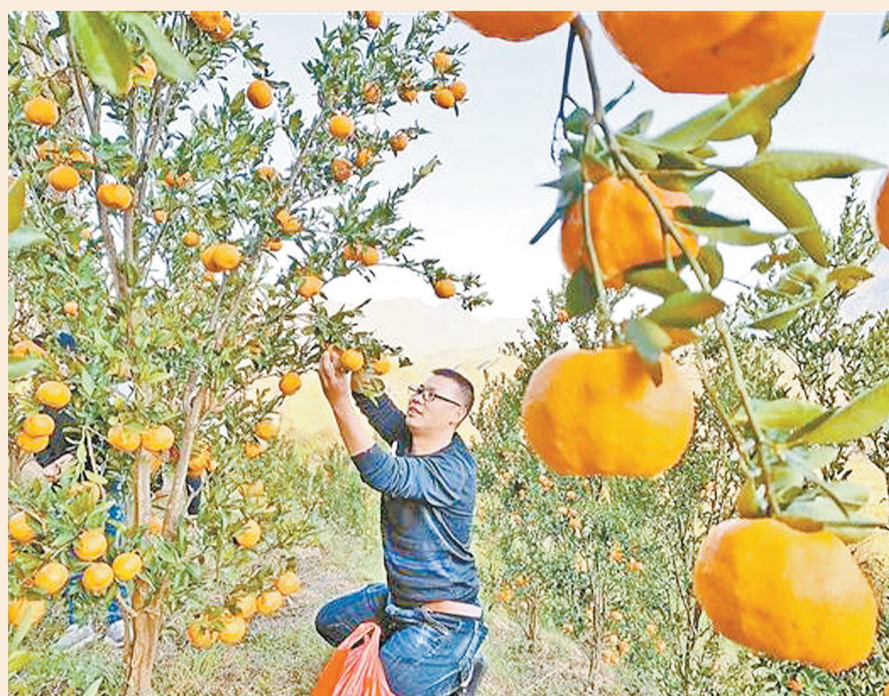
羅平縣九龍街道法塢村周圍山坡上的果樹掛滿了金黃色的碩大柑桔，許多游人攜親帶友前來採摘，體驗鄉村生活。

是時候開始收穫了。雲南通過近幾十年的布局，在向南擁抱的經濟格局中越來越呈現重要的地位。2018年雲南外貿進出口總額完成1973.02億元，創歷史新高，同比增長24.7%，增速排中國第5位。當然，不足2000億的盤子，較之沿海發達地區距離還非常大。但若站在雲南的區位和歷史看，已是一個了不起的成就。