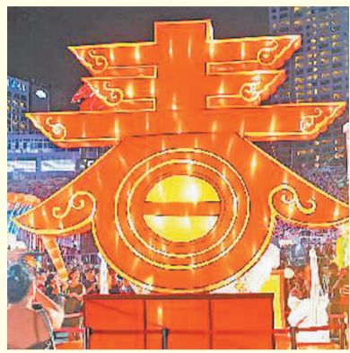
在新加坡濱海灣舉行的“春到河畔2019”迎新春活動。

這個合同金額30億美元的項目總建築面積約170萬平方米,包括20個高層建築單體及配套市政工程。時任埃及住房部長曾表示,項目建成後,埃及將真正擁有世界級的高檔中央商務區,坐擁非洲第一高樓,並帶動埃及蘇伊士運河經濟帶和紅海經濟帶開發,助推埃及國家復興計劃的實現。“春節期間正是大幹的時候,大家也沒