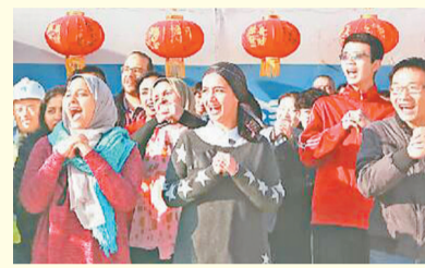
在埃及,當地工作人員與中國員工共度春節。