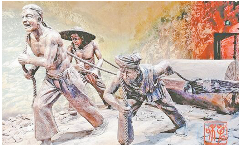
30萬民工奮戰在鐵路工地。圖為滇緬鐵路遺址博物館展廳中的雕塑

游。這一設想被英國政府採納,英國人戴維斯歷時7年,4次深入滇西南,足跡遍布臨滄、德宏、保山、思茅、大理,勘測滇緬鐵路的線路。1905年,滇緬鐵路出現在英國侵略者的地圖上。經雲南當局力爭,堅持“各修各費,各出各費”,保住了這條鐵路中國境內的路權。