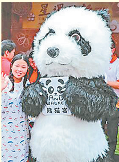
中國游客在泰國曼谷唐人街與熊貓人偶合影。