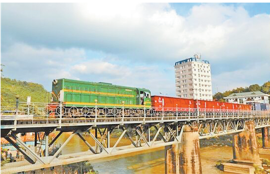
中亞班列通過位於雲南河口縣的中越鐵路大橋。

“哪……”隨着火車汽笛鳴響,滿載着雲天化股份紅磷分公司生產的、被東南亞市場賦予“綠寶石”美譽的化肥,通過中越米軌鐵路中亞班