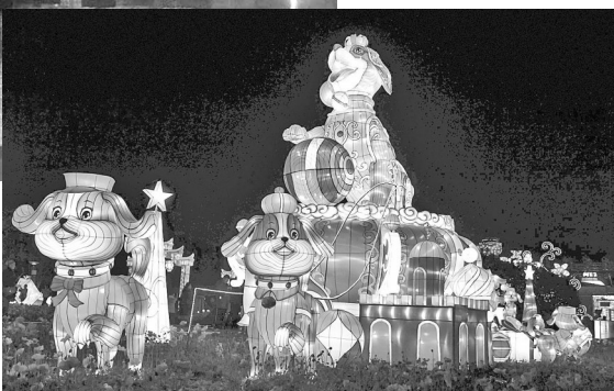
(下图)昆明世博园新春灯会上的彩灯

灯会是中国古老的民俗文化,春节前至元宵节时,各地都会举办大型的灯饰展览活动。今年春节,云南省昆明的灯会异彩纷呈。