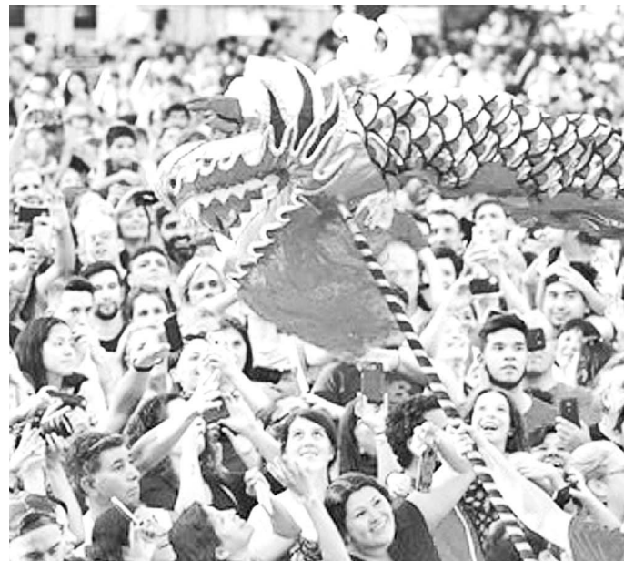
在阿根廷布宜诺斯艾利斯举行的中国春节庙会上,观众在拍摄舞龙画面。布宜诺斯艾利斯春节庙会除中国本土之外规模最大的海外春节庆祝活动,被市政府列入“布宜诺斯艾利斯庆典”系列活动,成为阿根廷本土知名文化品牌。