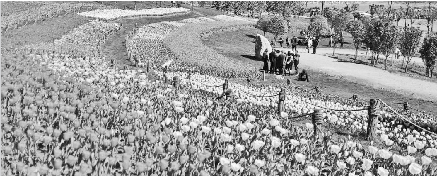
云南弥勒市太平湖森林公园郁金香花开如海。

早在冬末,云南的花事便拉开序幕:山茶和杜鹃铺满山野,粉红到深红,如霞似锦,在蓝天白云下璀璨怒放,让每一个走近它的游人心旌摇曳。