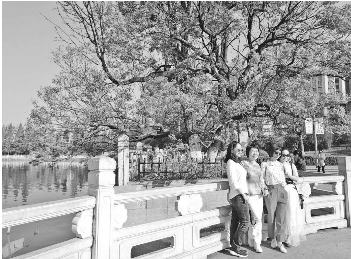
与昆明“网红花”——蓝花楹合个影。