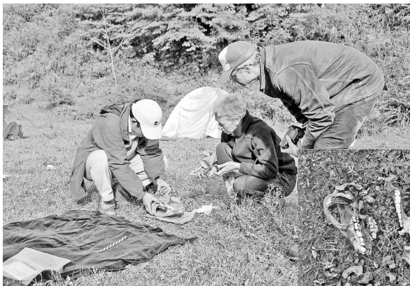
出土的大熊猫化石 (资料图片)