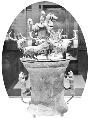
四牛鎏金骑士贮贝器 (云南晋宁石寨山出土)

各地政府对文物保护事业的认知不断提高，在将文物和非遗保护纳入当地经济和社会发展规划、纳入城乡建设规划、纳入财政预算等方面做了大量实实在在的工作。据统计，仅文物保护专项资金，中央和省级财政2010年至2019年共投入20亿多元。2018年起，省级非遗代表性传承人的传习活动补助从每人每年5000元提高至