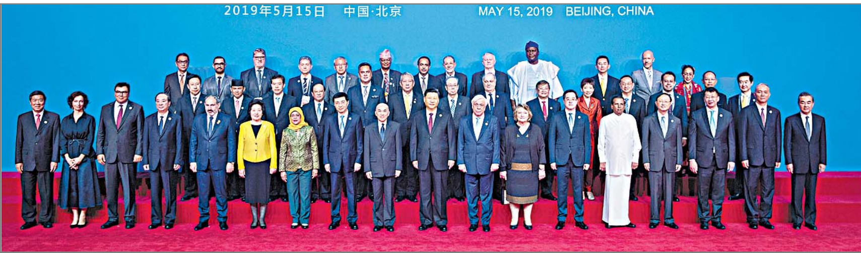
អ្នកដឹកនាំចិន និង ប្រទេសផ្សេងៗចូលរួមសម្ពោធសន្និសីទស្តីពីបើកសន្និសីទ

នៅថ្ងៃទី ១៥ ខែឧសភា ឆ្នាំ ២០១៩ ឯកឧត្តម ស៊ី ជីនភីង ប្រធានាធិបតីចិន បានអញ្ជើញចូលរួមក្នុងពិធីបើកសម្ពោធសន្និសីទស្តីពីការសន្ទនាអរិយធម៌អាស៊ីក្នុងប្រទេសចិន។ ឯកឧត្តមបានថ្លែងសន្ទនាសំខាន់ៗដែលមានចំណងជើងថា "ជំរុញការផ្លាស់ប្តូរអរិយធម៌ឱ្យកាន់តែស៊ីជម្រៅ រួមគ្នាកសាងសហគមន៍រួមវិស័យអាស៊ី" ។ ឯកឧត្តមបានសង្កត់ធ្ងន់ថា អរិយធម៌ចិនជាប្រព័ន្ធនៃទូលាយដែលត្រូវបង្កើតឡើង ដំណើរនៃការផ្លាស់ប្តូរជាមួយអរិយធម៌ផ្សេងៗទៀត ។ នាពេលអនាគត ប្រទេសចិននឹងឱ្យគ្នាជាមួយពិភពលោកតាមរយៈអាកប្បកិរិយាដែលមានលក្ខណៈកាន់តែលើកលែង ហើយជំរុញឱ្យអរិយធម៌ដែលកាន់តែមានកម្លាំងរស់រវើករួមចំណែកក្នុងការអភិវឌ្ឍន៍សេដ្ឋកិច្ច។ ឯកឧត្តម ស៊ី ជីនភីង បានគូសបញ្ជាក់ថា បច្ចុប្បន្ន និន្នាការពហុប្រជាពិភពលោក សាកលវិទ្យាល័យសេដ្ឋកិច្ច ភាពពិភពកម្ពុជាប្រជាជាតិ និងពិភពលោកកសាងសហគមន៍អាស៊ីអាគ្នេយ៍ កាន់តែទទួលបានលទ្ធផលល្អ ប៉ុន្តែនៅមានកម្លាំងវិជ្ជមានតិចតួច និងអរិយធម៌ខ្សោយ ពិសេសនៅក្នុងប្រទេសចិន។ ឯកឧត្តមបានសង្កត់ធ្ងន់ថា ប្រទេសចិននឹងជំរុញឱ្យអរិយធម៌ដែលកាន់តែមានកម្លាំងរស់រវើករួមចំណែកក្នុងការអភិវឌ្ឍន៍សេដ្ឋកិច្ច។