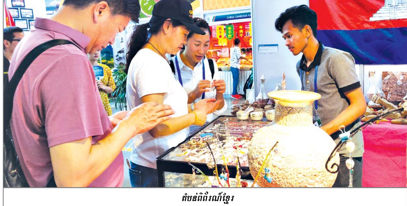
តំបន់ពិព័រណ៍ខ្មែរ

ក្នុងនាមជាមិត្តខ្មែរនៃពិព័រណ៍អន្តរជាតិខេត្តយួនណានសហគ្រាសកម្ពុជាជាច្រើនមកចូលរួមការតាំងពិព័រណ៍នៅក្នុងក្រុងកុនមីងខេត្តយួនណាន ។ ឆ្នាំនេះ ក្រសួងពាណិជ្ជកម្មកម្ពុជាបានអញ្ជើញឱ្យក្រុមហ៊ុនជនខ្មែរចំនួន២០មកចូលរួមពិព័រណ៍នេះនិងបានរៀបចំស្តង់ពិព័រណ៍