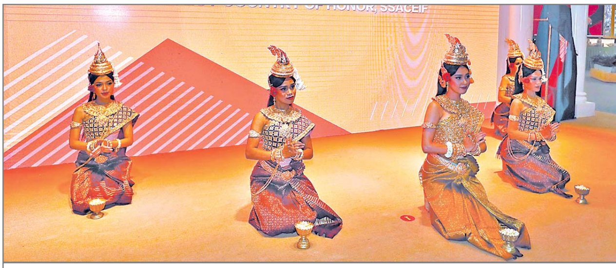
ពិធីបើកពិព័រណ៍ខ្មែរក្នុងពិព័រណ៍ពាណិជ្ជកម្ម ឆ្នាំ ២០១៩

ប្រទេសកម្ពុជាជាក្រៅកិច្ចសន្តិវិធីពិព័រណ៍ពាណិជ្ជកម្មនេះ ។ នៅពេលពិព័រណ៍ខ្មែរមានផ្ទះសង់ខ្ពស់ពីដីដែលសង់ឡើងនៅមាត់សមុទ្រ ក្នុងទឹកដីដែលបានតែងតាំងឡើងដោយរដ្ឋបាលបឹងទន្លេមេគង្គ ក្នុងតំបន់ដែលបានសម្រេចបានពីសេចក្តីស្នើសុំរបស់រដ្ឋបាលបឹងទន្លេមេគង្គ ទាក់ទងនឹងការសាងសង់បឹងទន្លេមេគង្គ និងការសាងសង់បឹងទន្លេមេគង្គ ។