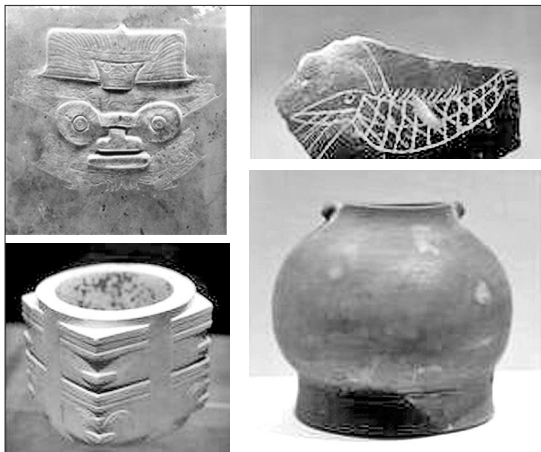
良渚文化遗址出土的文物

九百六十万平方公里的广袤大地上,中华文明遗存星罗棋布。55项世界遗产,钩沉着泱泱古国的历史记忆,不仅令中国人骄傲,还惊艳了世界。