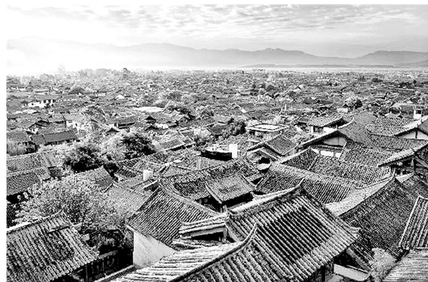
丽江古城