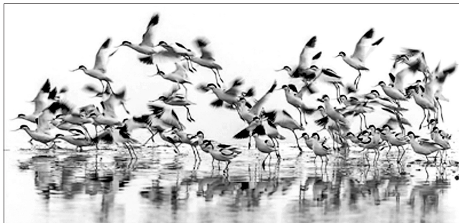
一群反嘴鹈在江苏盐城湿地珍禽国家级自然保护区内翩翩起舞。