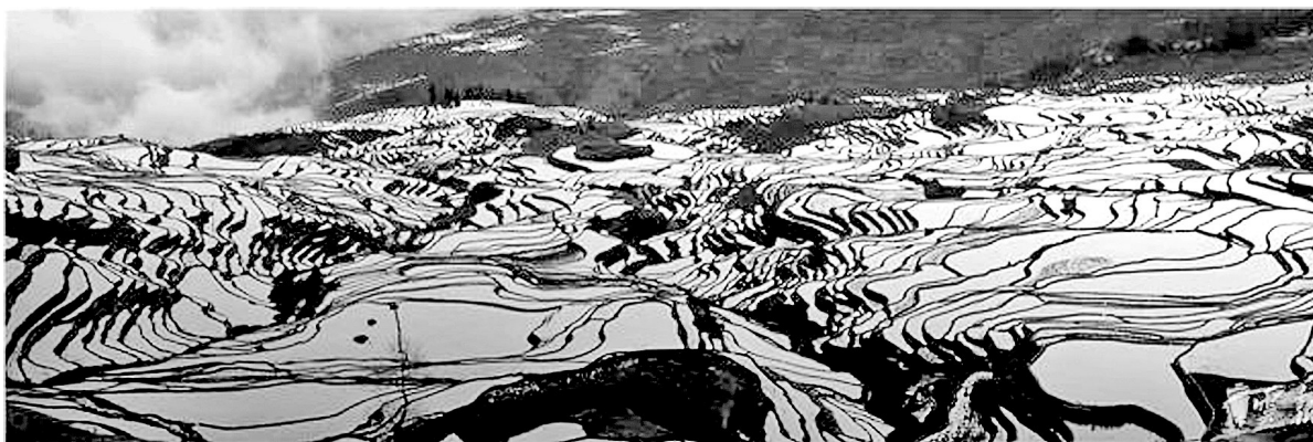
哈尼梯田