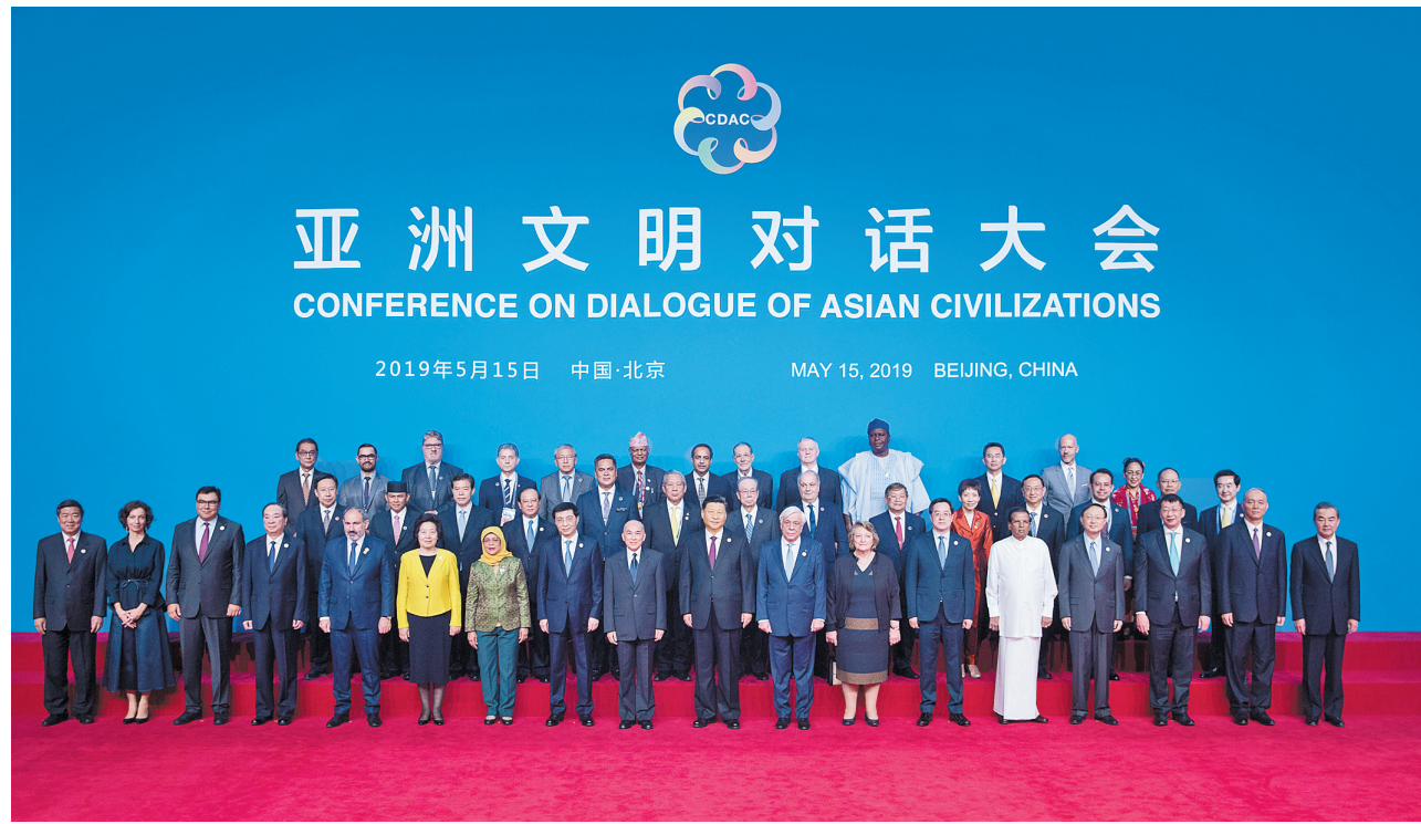
Sebelum upacara pembukaan, para pemimpin Tiongkok dan asing berfoto bersama dengan tamu-tamu penting yang hadir di upacara pembukaan.

Presiden China Xi Jinping menunjukkan bahwa saat ini, multi-polarisasi dunia, globalisasi ekonomi, keanekaragaman budaya, dan informatisasi sosial berkembang secara mendalam, dan masyarakat manusia penuh dengan harapan. Pada saat yang sama, ketidakpastian dan ketidakstabilan situasi internasional lebih menonjol, tantangan global yang dihadapi manusia semakin keras. Untuk mengatasi tantangan bersama dan menuju ke masa depan yang lebih baik, dibutuhkan kekuatan ekonomi dan teknologi serta kekuatan budaya dan peradaban. Konferensi Dialog Peradaban Asia menyediakan platform baru untuk mendorong dialog yang setara, pertukaran, dan pencerahan di antara Asia dengan peradaban