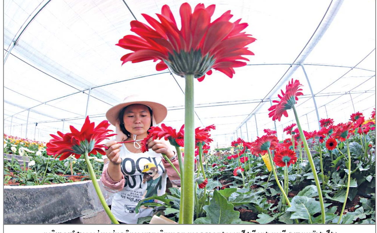
កសិករនាំផ្កាស្រស់របស់បណ្តាស្រុកកសិកម្មខេត្ត យួនណានក្នុងស្រុកវីស៊ី ក្រុង យូស៊ី