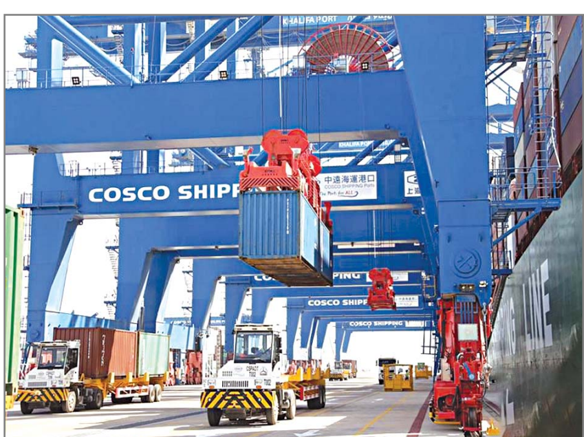
នាវាខ្នាតធំមួយ ចតជាលើកទី១ នៅក្រុងហ្គីន COSCO SHIPPING LINES ក្នុងក្រុងអាប៊ុយដាហ៊ី។

គំនូរដ៏ស្រស់ស្អាតមួយផ្ទាំង ឈ្មោះថា “ពិភពលោកចម្រុះពណ៌ ប្រកបដោយកម្លាំងរស់រវើក” បានបង្ហាញពីទិដ្ឋភាពមួយដែលមានមុខញញឹមរបស់មនុស្សច្រើនមានអាយុខុសគ្នា ក្នុងប្រទេសចិនមានសម្បុរពណ៌ខុសគ្នា ហើយប្រកបដោយរសាសន៍ផែនទីពិភពលោក ។ គំនូរនេះបានបញ្ជាក់ឱ្យឃើញពីក្តីសង្ឃឹមនៃជំនាញដ៏ល្អរបស់មនុស្សជាតិ ។ ពិសេសគឺគំនូរអន្តរជាតិមួយកំពុងត្រូវរៀបចំនៅក្នុងសារមន្ទីរវិចិត្រសិល្បៈចិនក្រោមប្រធានបទ “ពិភពលោកចម្រុះពណ៌និងជោគវាសនារួម” ។ ស្នាដៃរបស់វិចិត្រករ ៥៥៥ រូប ដែលមកពីប្រទេសចិន ១១៣ បានត្រូវដាក់តាំងបង្ហាញជូនសាធារណជនក្នុងពិធីរំលឹកនេះ ។ ក្នុងឱកាសនៃការអបអរសាទរដល់ពិធី ៧០ឆ្នាំ នៃការបង្កើតប្រទេសចិនថ្មីនេះ គំនូរស្នាដៃ ទាំងនោះក៏អាចបង្ហាញឱ្យឃើញពីការប្រែប្រួលនៃប្រទេសចិន និងពិភពលោកក្នុងរយៈពេល៧០ឆ្នាំកន្លងទៅ ។