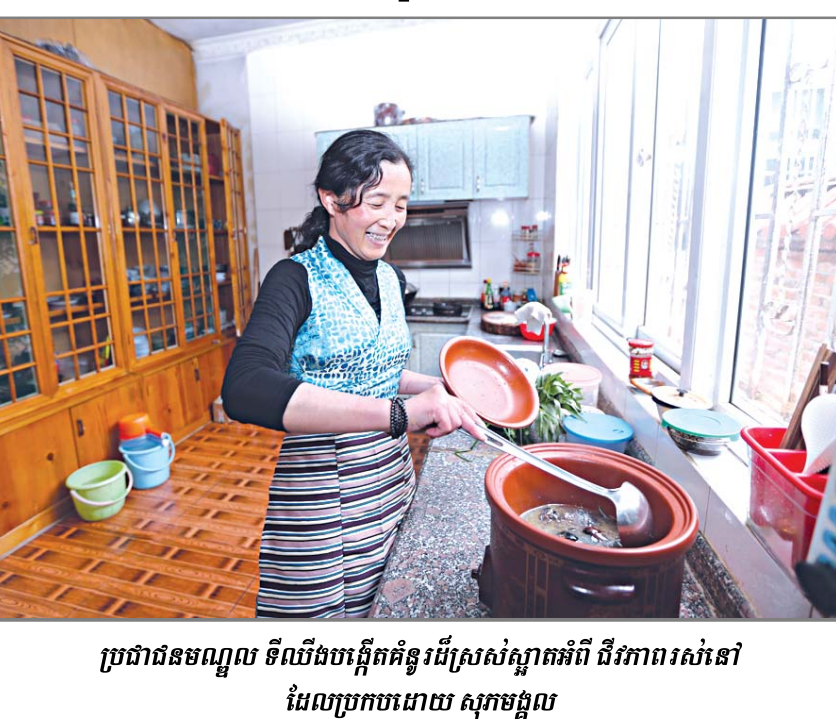
ប្រជាជនមណ្ឌល ទីលំនៅដ៏ស្រស់ស្អាតអំពី ជីវភាពរស់នៅ ដែលប្រកបដោយ សុភាពស្រស់ស្អាត

ពាក្យថា “ទីលំនៅ” ក្នុងភាសាទីបេ មានន័យថា “កន្លែងប្រកបដោយសិរីមង្គល” ។ ក្នុងរយៈពេល៧០ឆ្នាំកន្លងទៅក្រោយពីបង្កើតសាធារណរដ្ឋប្រជាមានិតចិនរៀបរយ មណ្ឌលស្រស់ស្អាតជាតិទីបេទីលំនៅដ៏ស្រស់ស្អាតបានត្រូវសាងសង់ឡើងដ៏អស្ចារ្យមួយខ្សែដែលបានបង្ហាញពីសមិទ្ធផលអភិវឌ្ឍន៍សេដ្ឋកិច្ចលើខ្ពង់រាបថែរក្សាស្ថិរភាពក្នុងសង្គមរួមសាមគ្គីគ្រប់ជនប្រជាជន និងកែលម្អអេកូ-បរិស្ថាន ។