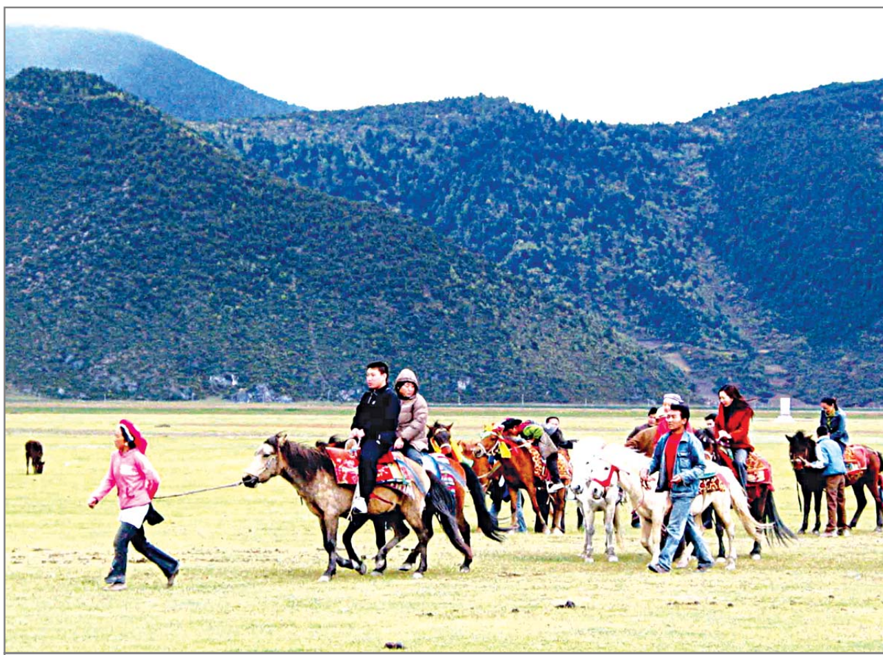
ទេសចរដើរលេងវាលស្មៅ យីវ៉ា នៅតំបន់សាវ័ងគ្រីឡា

ប៉ុន្មានឆ្នាំនេះ ខេត្តយួនណានបានធ្វើបដិវត្តន៍ទេសចរណ៍លើវិស័យសំខាន់ ពោធិ៍ គ្រប់គ្រងប្រព័ន្ធទេសចរណ៍វិទ្យុស្តាត និងផ្តល់សេវាកម្មទំនើបទំនើប ហើយអាចប្តូរយកលុយវិញដោយគ្មានលក្ខខណ្ឌ ។ ទេសចរដែលមកដើរលេងខេត្តយួនណានបានរកឃើញថា ខេត្តយួនណានបានកែលម្អបរិស្ថានទេសចរណ៍ និងផ្តល់សេវាកម្មទេសចរណ៍កាន់តែល្អប្រសើរ ។