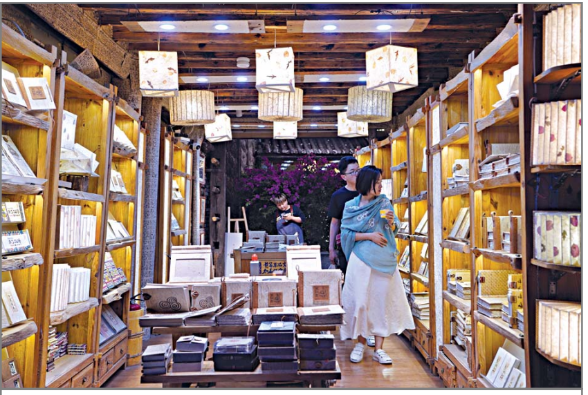
ទេសចរ កំពុងរើសទិញនិលតិលវប្បធម៌ក្រដាស តុងប៉ា

វប្បធម៌ តុងប៉ា ជាផ្នែកសំខាន់មួយនៃវប្បធម៌ជនជាតិណាស៊ី នៅខេត្តយួនណាន ។ ក្រដាសតុងប៉ា ជាវត្ថុសំខាន់មួយសម្រាប់កាត់ត្រានិងផ្សព្វផ្សាយនូវវប្បធម៌តុងប៉ា ។ ជនជាតិណាស៊ីចូលចិត្តសរសេរធម៌តុងប៉ា និងគូរគំនូរតុងប៉ាលើក្រដាសតុងប៉ា ។