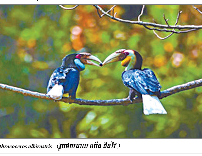
សត្វ Anthracoceros albirostris

លោកសាស្ត្រាចារ្យ ហាន លានសៀន ដែលមកពីសាកលវិទ្យាល័យរុក្ខកម្មភូមិភាគនិរតីចិន បានធ្វើការសិក្សាស្រាវជ្រាវអំពីសត្វ Anthracoceros albirostris នៅមណ្ឌលស្វយ័តតីហុង ជាង ១០ ឆ្នាំហើយ ។ លោកបានប្រាប់អ្នកកាសែតថា សត្វ Anthracoceros albirostris ជាសត្វសំខាន់មួយប្រភេទក្នុងតំបន់ត្រូពិច ហើយក៏ជាមិត្តសញ្ញានៃសុខភាពព្រៃឈើក្នុងតំបន់ត្រូពិចដែរ ។