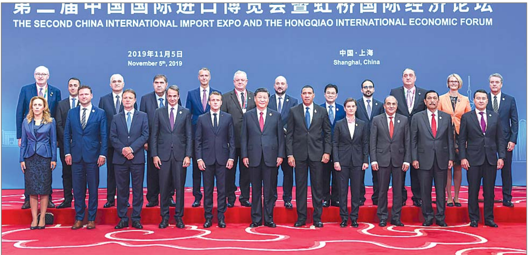
នៅថ្ងៃទី៥ ខែវិច្ឆិកា ឯកឧត្តម ស៊ី ជិនភីង ប្រធានាធិបតីចិន ថតរូបជាមួយអ្នកដឹកនាំនៃប្រទេសផ្សេងៗ មុននឹងចូលរួមពិព័រណ៍នាំចូលចិន អន្តរជាតិលើកទី២ ។

កាលពីថ្ងៃទី ៥ ដល់ទី១០ ខែ វិច្ឆិកា ឆ្នាំ២០១៩ ពិព័រណ៍នាំចូល ចិនអន្តរជាតិលើកទី ២ បានរៀបចំនៅ ក្រុងសៀងហៃ ។ ឯកឧត្តម ស៊ី ជិនភីង ប្រធានាធិបតីចិន បានអញ្ជើញចូលរួម និងថ្លែងសុំរកថាភាពពិព័រណ៍នាំចូល ចិនអន្តរជាតិលើកទី ២ និងពិធីបើក វេទិកាសេដ្ឋកិច្ចអន្តរជាតិ ហុងឈីវ ។