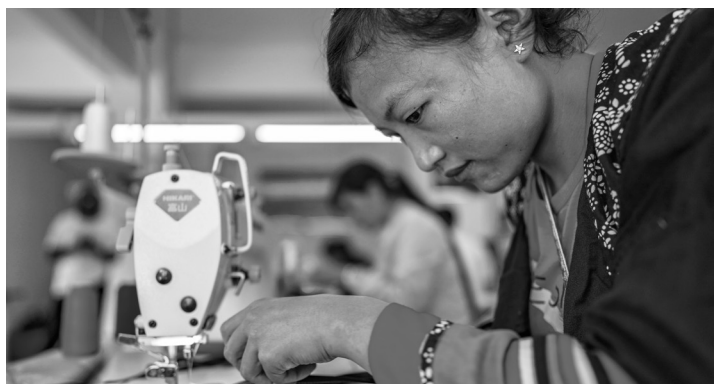
▲巴尼小镇易地扶贫搬迁安置点居民在扶贫车间内制作民族服饰

巴尼小镇是云南省怒江州首个易地扶贫搬迁集中安置点。从山上的金满村搬迁到巴尼小镇，近3年的时间里，搬迁户们的