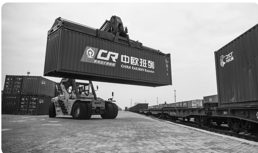
在广西钦州港东站，吊车在装运中欧班列货物。

美国《华尔街日报》网站日前刊文指出，中国经济在2020年增长2.3%，成为新冠疫情下全球率先实现正增长的主要经济体，凸显中国防控疫情取得的成就。当大部分国家的制造业因为疫情陷入停滞