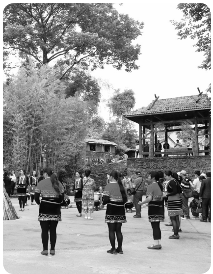
司莫拉佤族群众为游客表演歌舞。