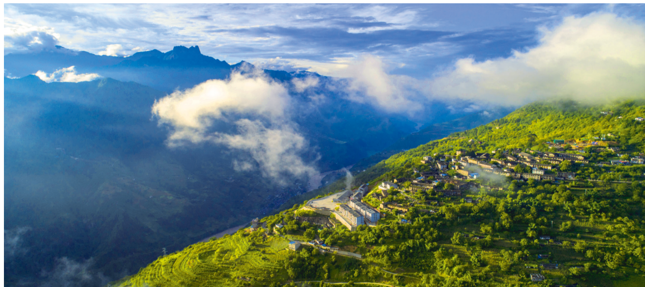
怒江大峽谷一景

編者按：雲南省迪慶藏族自治州、怒江傈僳族自治州是“三江并流”世界自然遺產地的核心區域。高山峽谷間，怒江、瀾滄江、金沙江三條大江奔騰不息，風景如畫。但這裏也屬於中國深度貧困地區。近年來，當地用綠色發展的方式解決了居住在自然保護區、國家公園周邊貧困群眾脫貧問題，走出一條可持續發展的脫貧之路。本刊繼續刊出文章，與讀者分享當地民眾端起“生態碗”走上脫貧路的故事。